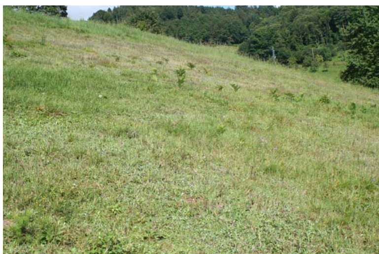
Borstgrasrasen [*6230] auf dem Sohlberg an einem südexponierten, flachgründigen Hang mit dichten Rasen des Kleinen Habichtskrauts ( Hieracium pilosella ) und dem derzeit einzigen bekannten Vorkommen der Rotflügeligen Schnarrschrecke ( Psophus stridulosus ) im Nordschwarzwald.