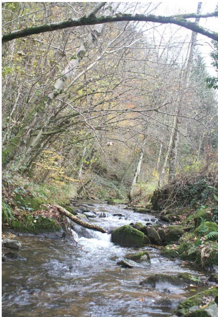
Maisach [3260] mit galerieartigem Auwaldstreifen (prioritär) [*91E0] Franz-Josef Schiel, 04.11.08