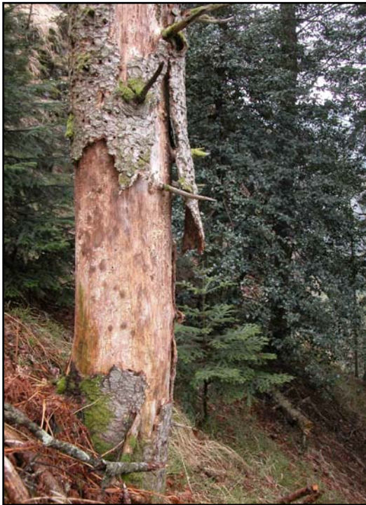
Abgestorbene Tanne im NSG „Eckenfels“ mit Einhieben des Schwarzspechtes. C. Purschke und F. Hohlfeld