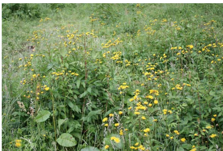
Hochstaudenflur [6430] an einem quellig-sumpfigen Wiesenunterhang im Wahlholz mit Vorkommen u.a. von Mädesüß ( Filipendula ulmaria ) und – gelb blühend – Sumpf-Pippau ( Crepis paludosa ).