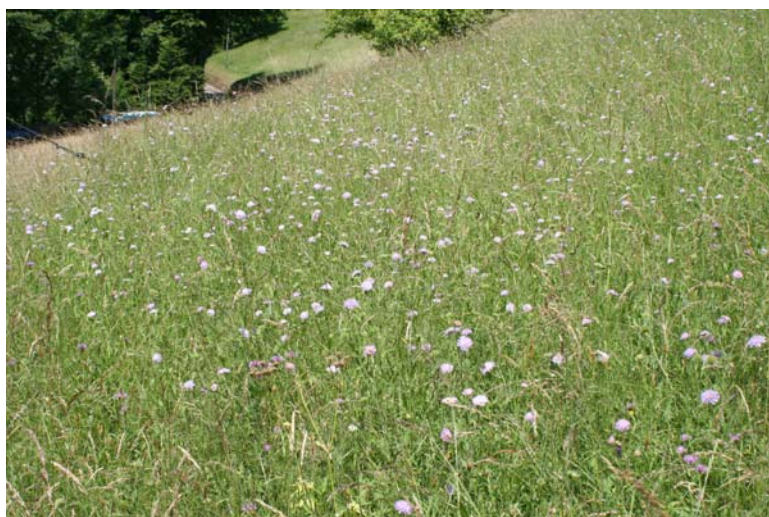
Magere Flachland-Mähwiese [6510] in der Wilden Rench mit flächigem Blühaspekt der Acker-Witwenblume ( Knautia arvensis ). Franz-Josef Schiel, 18.08.08