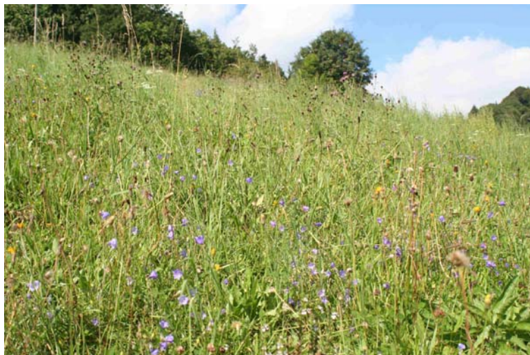
Magere Flachland-Mähwiese [6510] auf dem Sohlberg bei Lautenbach mit Rundblättriger Glockenblume ( Campanula rotundifolia ) und Hain-Flockenblume ( Centaurea nigra )