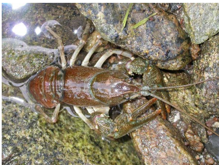
Steinkrebs ( Austropotamobius torrentium ) [1093] aus dem Ramsbächle/Oppenau