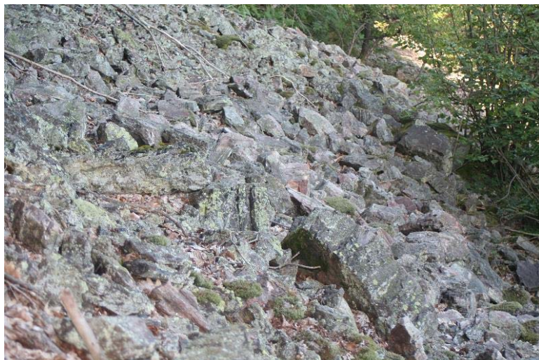
Silikatschutthalde [8150] im NSG „Eckenfels“.