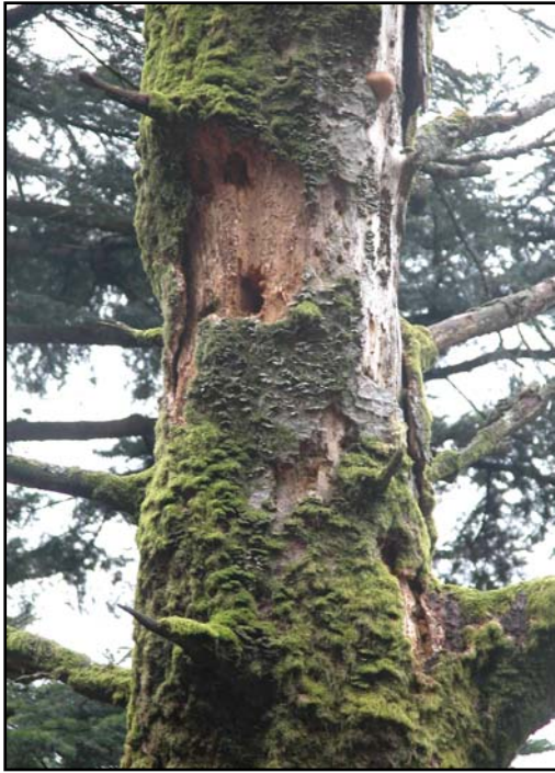
Alte Schwarzspechthöhle (Nahrungsbaum) in toter Tanne im NSG „Eckenfels“. C. Porschke und F. Hohlfeld