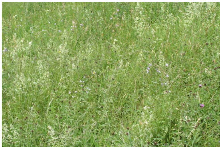
Magere Flachland-Mähwiese [6510] im Wahlholz mit flächigem Blühaspekt von Weißem Labkraut ( Galium album ), Wiesen-Glockenblume ( Campanula patula ) und – erst zu einem kleinen Teil aufgeblüht – Hain-Flockenblume ( Centaurea nigra ). Franz-Josef Schiel, 18.08.08