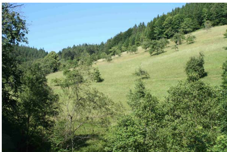
Magere Flachland-Mähwiesen [6510] sind im „Nördlichen Talschwarzwald bei Oppenau“ oft mit Streuobst bestockt. Im Gegensatz zum Südschwarzwald sind die Wiesentäler jedoch nur inselartig im Wald verteilt und haben – wie im abgebildeten Fall – oft keine direkte Verbindung mehr zu anderem Offenland; Breitenberg.