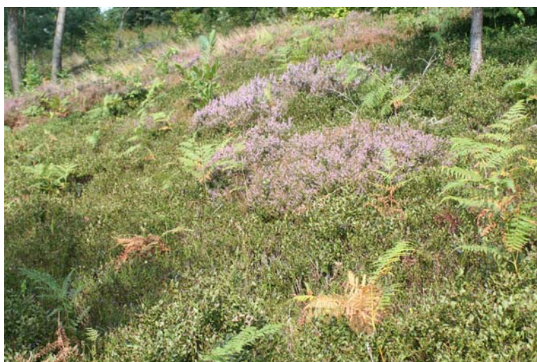
Trockene europäische Heide [4030] auf einem ehemaligen Weidfeld auf der Kuppe des Sohlberg; zu erkennen sind große Bestände von Heidelbeere ( Vaccinium myrtillus ) und Heidekraut ( Calluna vulgaris ) sowie Adlerfarn ( Pteridium aquilinum ).