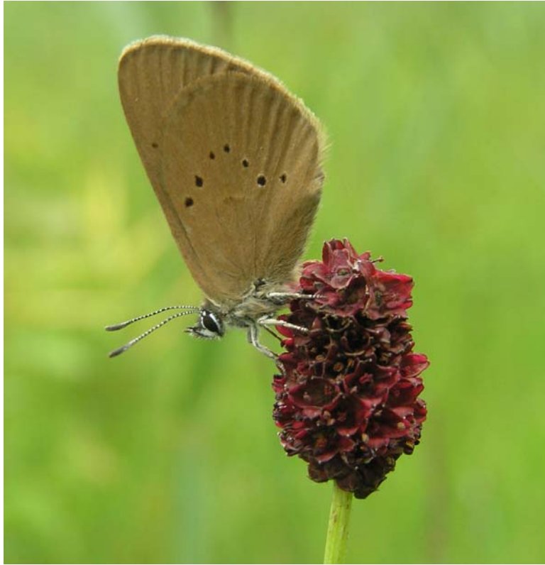
Dunkler Wiesenknopf- Ameisenbläuling ( Maculinea nau- sithous ) [1061] auf der Raupen- fraßpflanze Großer Wiesenknopf ( Sanguisorba officinalis ).