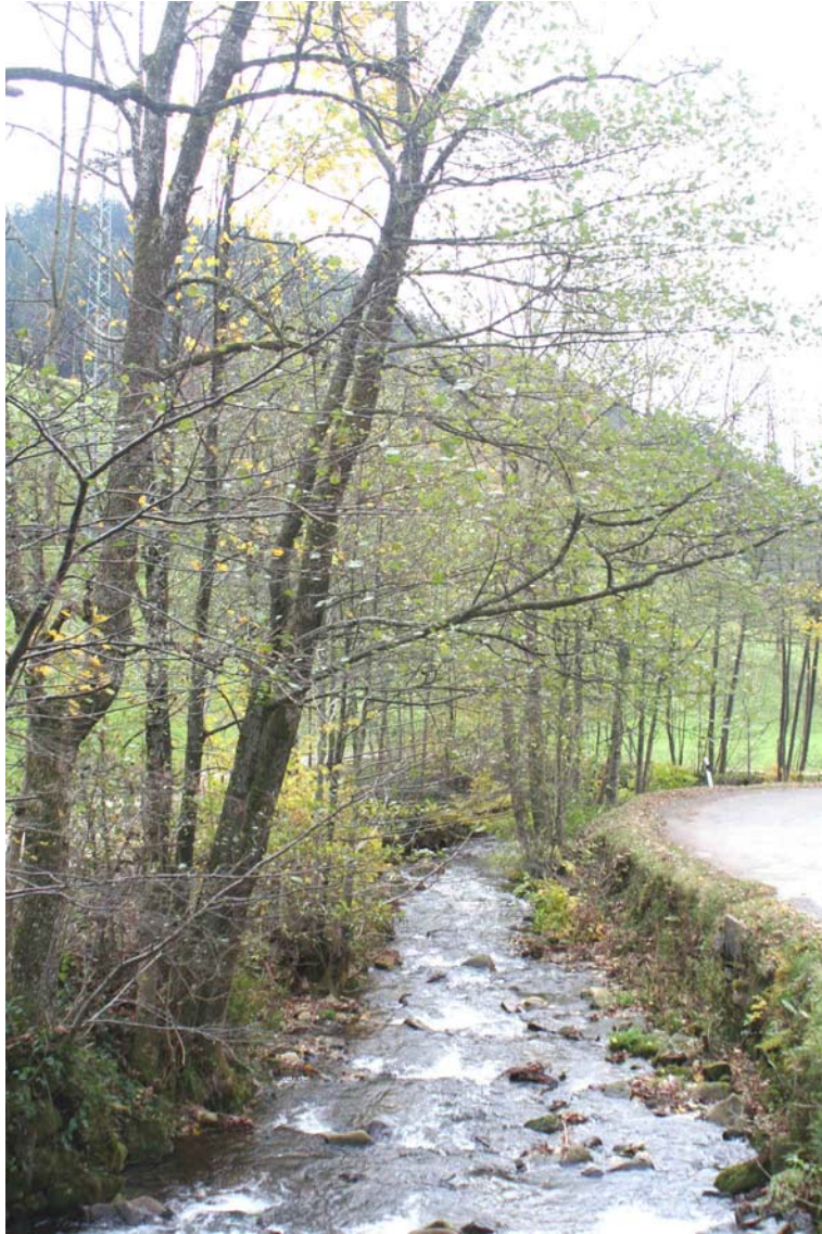
Galerieartige Auwaldstreifen (prioritär) [*91E0] an der wegen der ausgebauten Ufer nicht naturnahen Wilden Rench.