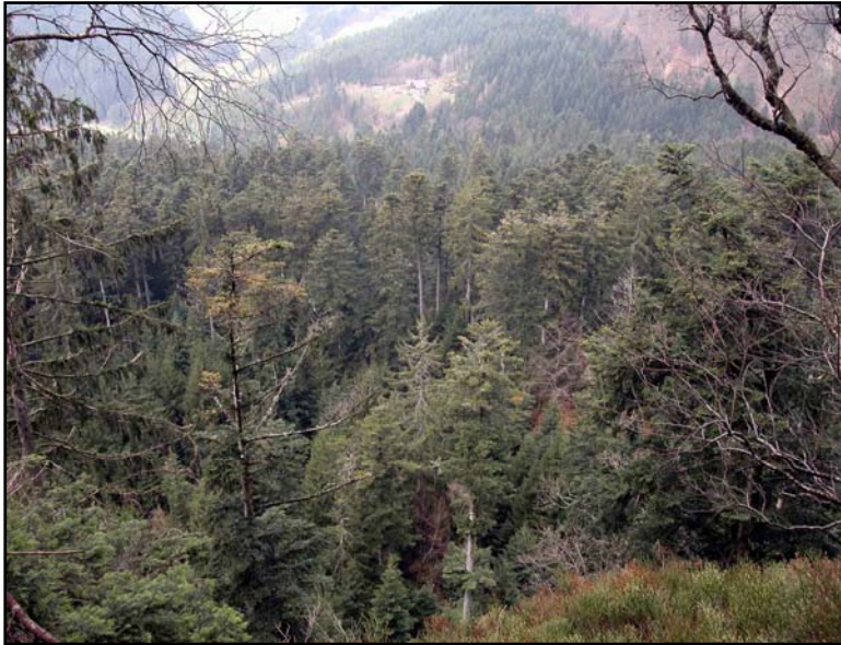
Bereich mit Schwarzspechtregistrierungen im NSG „Eckenfels“. C. Purschke und F. Hohlfeld