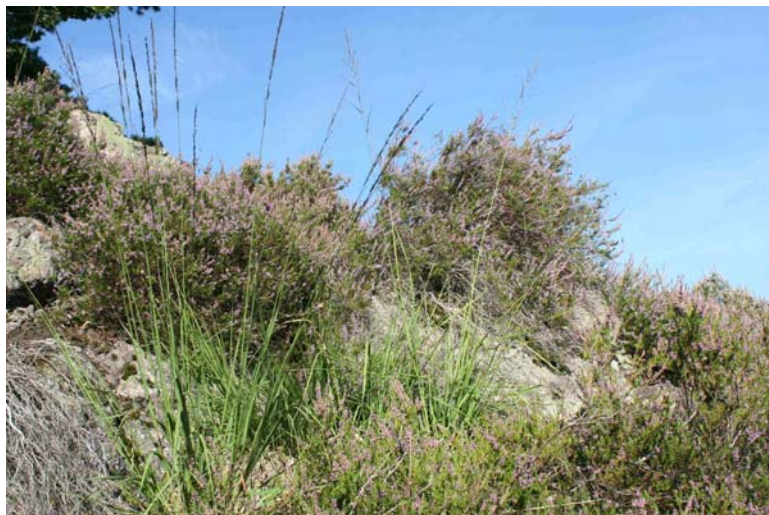
Trockene europäische Heide [4030] auf einem Felskopf des NSG „Eckenfels“ mit Heidekraut ( Calluna vulgaris ) und Pfeifengras ( Molinia caerulea ).