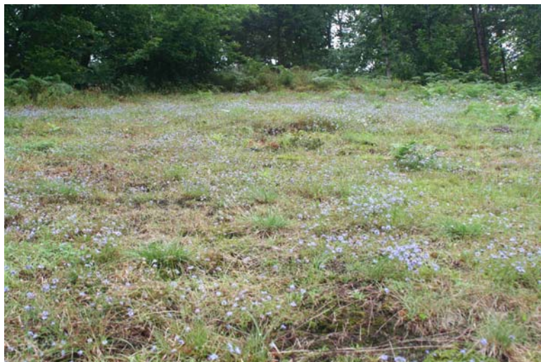
Borstgrasrasen [*6230] im Wahlholz bei Oppenau-Lierbach mit großen Beständen der Ausdauernden Sandrapunzel ( Jasione laevis ).