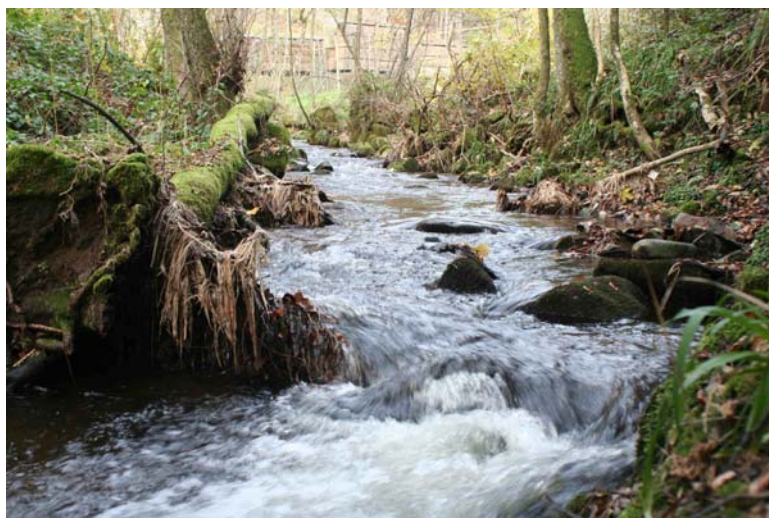
Wilde Rench [3260] mit Auwaldstreifen (prioritär) [*91E0], Franz-Josef Schiel, 04.11.08