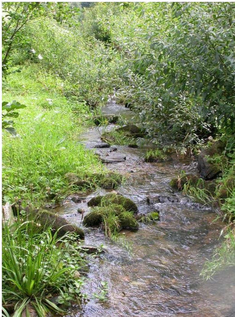
Ramsbächle W „Oppenau“, Habitat des Steinkrebsses ( Austropotamobius torrentium ) [1093]