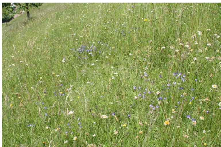
Sehr lückige Berg-Mähwiese [6520] an einem Oberhang im Teilgebiet „Wilde Rench“ mit Anklängen an Flachland-Mähwiesen. Blühend: Rundblättrige Glockenblume ( Campanula rotundifolia ), verblühend: Wiesen-Margerite ( Leucanthemum ircuti-anum ). Franz-Josef Schiel, 18.06.08