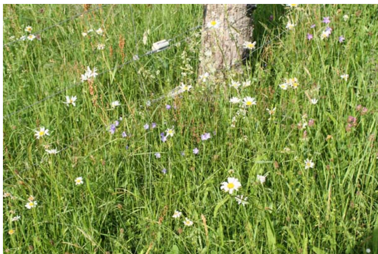
Magere Flachland-Mähwiese [6510] im Wahlholz, die mit Rindern beweidet wird. Das Bild belegt, dass bei entsprechendem Management auch beweidete Flächen ihren „Mähwiesencharakter“ beibehalten können. Auf dem Foto zu erkennen sind u.a. Rundblättrige und Wiesen-Glockenblume ( Campanula rotundifolia , C. patula ), Wiesen-Margerite ( Leucanthemum ircutianum ), Sauerampfer ( Rumex acetosa ) und Rotklee ( Trifolium pratense ). Franz-Josef Schiel, 14.06.08