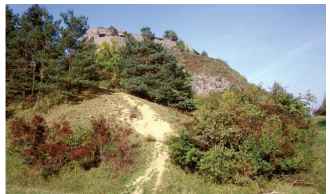
Kalkmagerrasen im NSG Hohentwiel (M. Witschel)

Trocken- und Halbtrockenrasen sind charakteristisch für viele Naturräume Baden-Württembergs. Standortbedingungen und jahrhundertelange, standortangepasste, extensive Nutzung haben Lebensbedingungen für bedrohte Tiere und Pflanzen (Schmetterlinge, Orchideen) geschaffen. Diese Lebensräume sind daher unersetzlich für den Arten- und Biotopschutz. Kalk-Magerrasen sind nach Landesnaturschutzgesetz (NatSchG) bzw. Bundesnaturschutzgesetz (BNatSchG) geschützt.