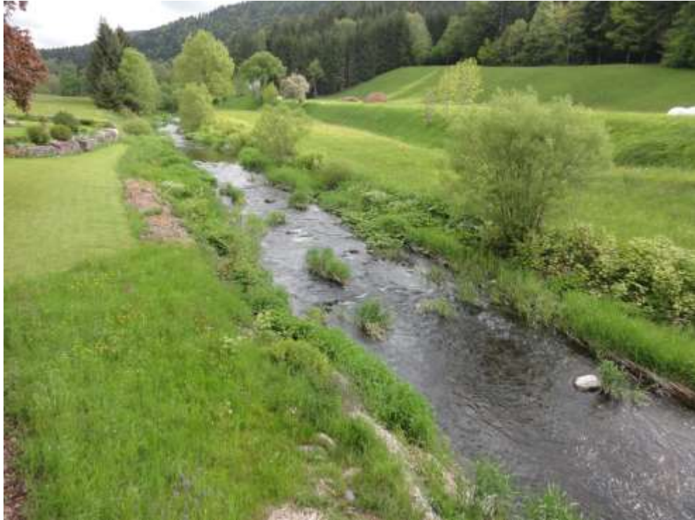
Bild 3: Die Alb im Offenland entspricht auf zahlreichen Abschnitten dem Lebensraumtyp Fließgewässer mit flutender Wasservegetation [3260].