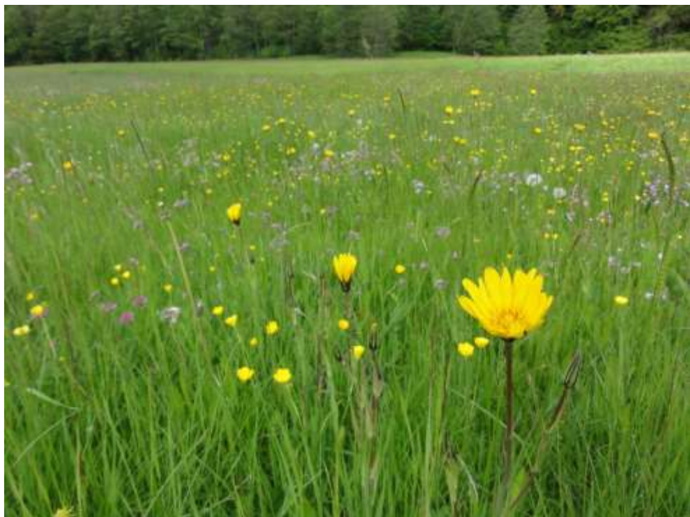
Bild 10: Der Lebensraumtyp Magere Flachland-Mähwiese [6510] ist im Gebiet häufig in frischer bis mäßig feuchter Ausbildung vorhanden. Neben dem Orientalischen Wiesen-Bocksbart ( Tragopogon orientalis) sind daher Feuchtezeiger, wie z. B. Kuckucks-Lichtnelke ( Lychnis flos-cuculi), regelmäßig beigemischt.