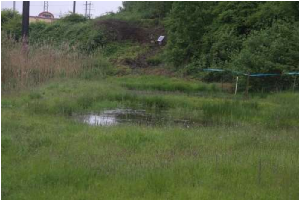
Bild 31 Gut besonnte Potentialgewässer für den Kammmolch ( Triturus cristatus) [1166] im Teilgebiet Luttingen.