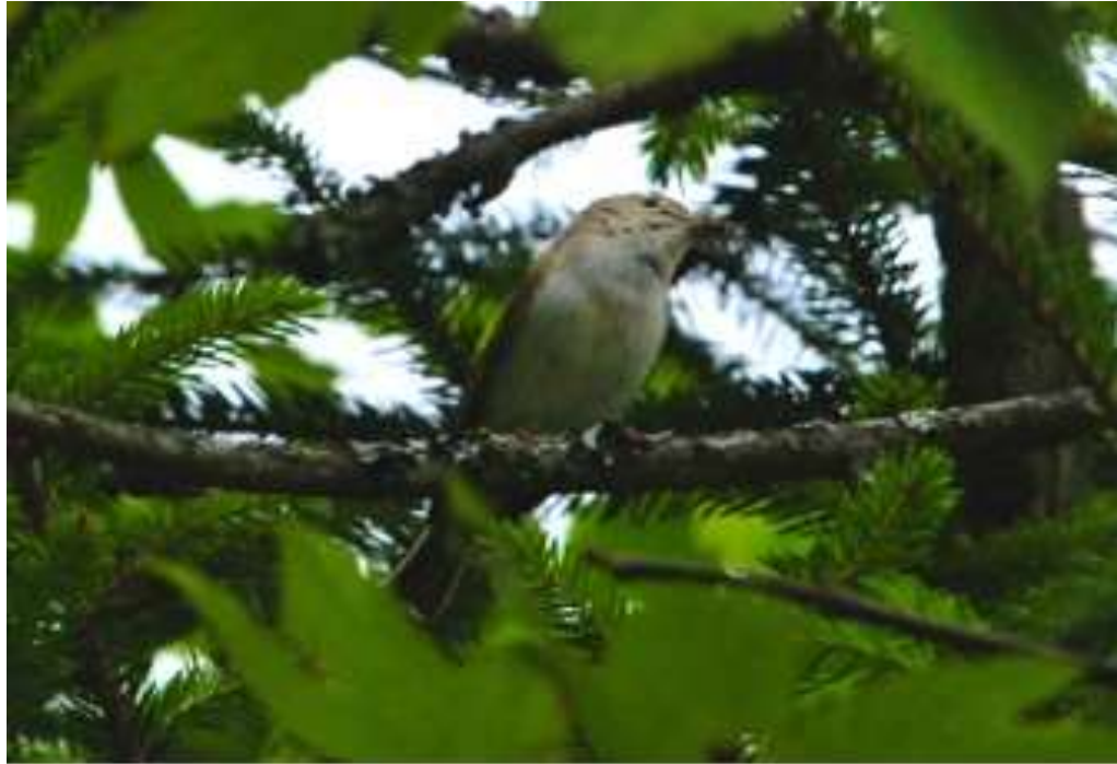
Bild 27: Berglaubsänger ( Phylloscopus bonelli ) [A313] im Unteren Albtal. Brutnachweis durch futtertragenden Altvogel; am 02.06. wurden die Beobachter zunächst durch Warnrufe auf Männchen und Weibchen aufmerksam; im Verlaufe der Beobachtung konnte auch der Neststandort lokalisiert werden.