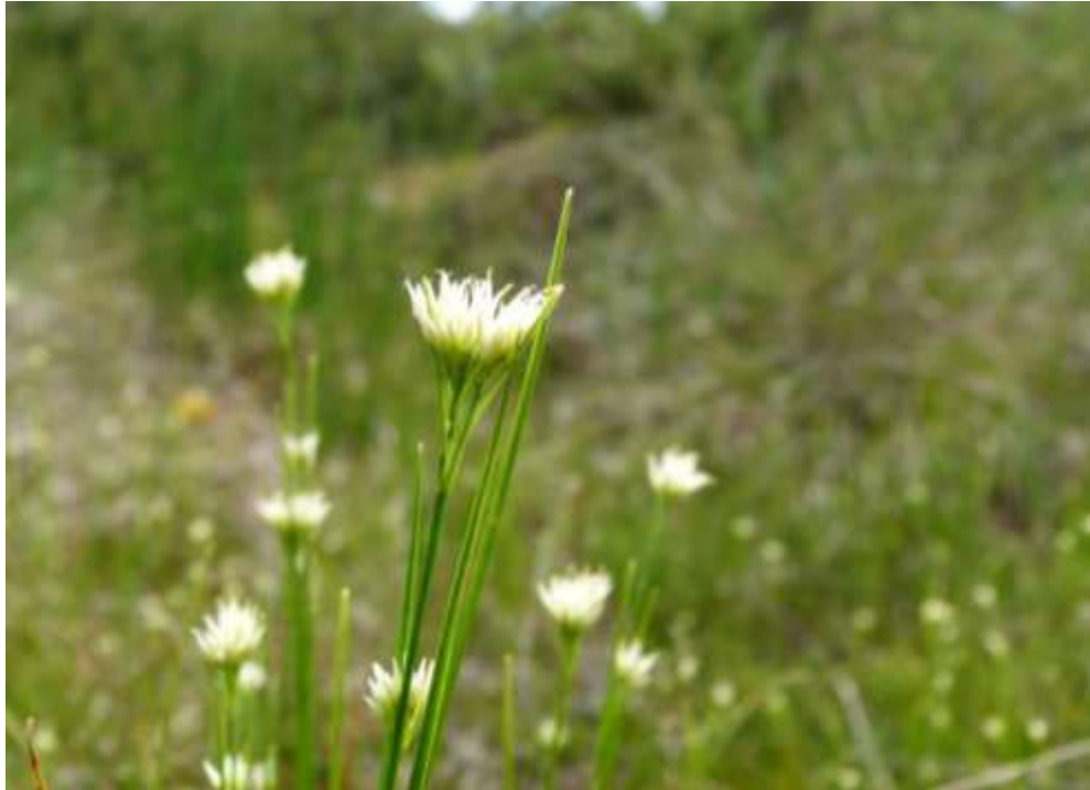
Bild 13: Die Weiße Schnabelsimse ( Rynchospora alba ) charakterisiert die Torfmoor-Schlenken (Rhynchosporion) [7150]. Auch dieser Lebensraumtyp ist im FFH-Gebiet nur im Naturschutzgebiet „Tiefenhäuser Moos“ zu finden.