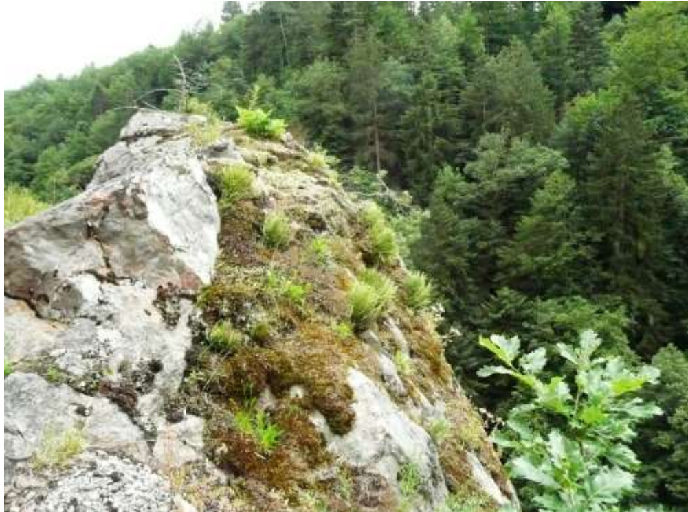
Bild 15: Lebensraumtyp Pionierrasen auf Silikatfelskuppen [8230] im Wald. Zu den charakteristischen Arten zählen auch zahlreiche Flechten.