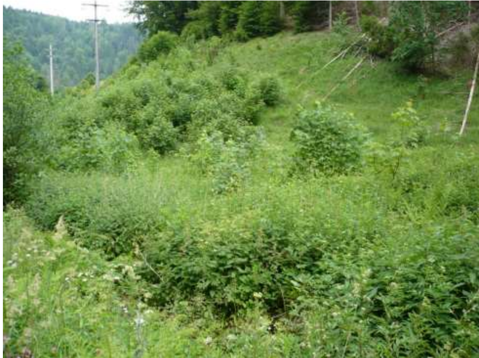
Bild 7: Lebensraumtyp Feuchte Hochstaudenfluren [6431] am Waldrand.