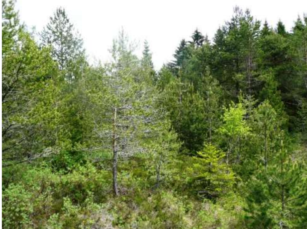
Bild 17: Lebensraumtyp Moorwälder [91D0*] im Naturschutzgebiet „Tiefenhäuser Moos“. Die prägende Baumart ist die Moor-Kiefer, auch Spirke ( Pinus mugo subsp. rotundata) genannt.