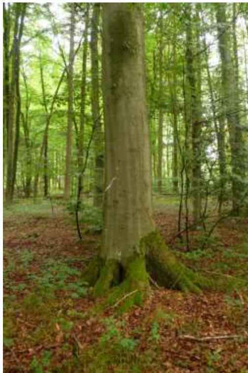
Bild 20: Grünes Besenmoos ( Dicranum viride ) [1381] auf einem Trägerbaum (Rotbuche Fagus sylvatica ) im Bereich der Ortschaft Grunholz.