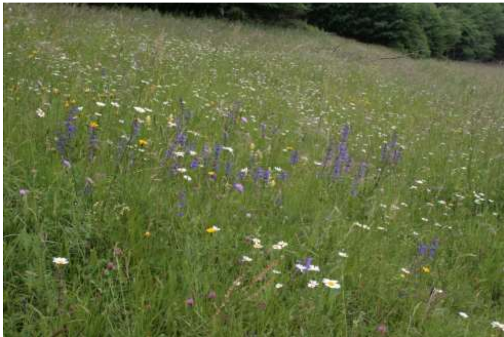
Bild 8: Salbei-Glatthaferwiesen als mäßig trockene Ausbildungen des Lebensraumtyps Magere Flachland-Mähwiesen [6510] sind im Gebiet sehr selten. Diese artenreiche Ausbildung mit Wiesen-Salbei ( Salvia pratensis ) und Wiesen-Margerite ( Leucanthemum ircutianum ) wird beweidet.