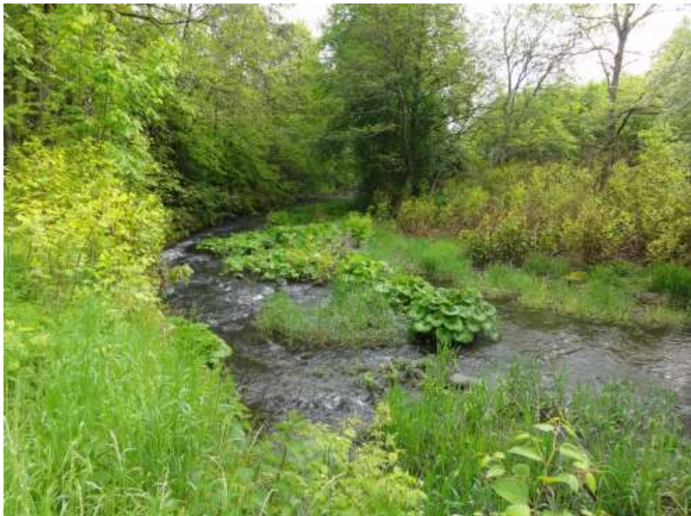
Bild 6: Auf Kiesbänken entlang und in der Alb wird der Lebensraumtyp Feuchte Hochstudenfluren [6431] häufig durch die Pestwurz ( Petasites hybridus ) aufgebaut. Im Hintergrund ist die gewässerbegleitende Vegetation durch Neophyten (Japanischer Staudenknöterich, Reynoutria japonica ) beeinträchtigt.