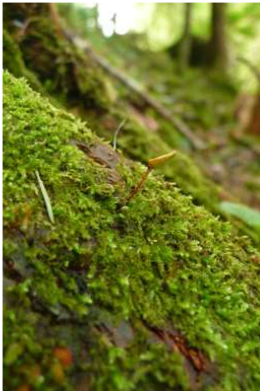
Bild 22: Ein Sporophyt des Grünen Koboldmooses ( Buxbaumia viridis ) [1386] auf einer Trägerstruktur am Albufer bei Bantlisloch.