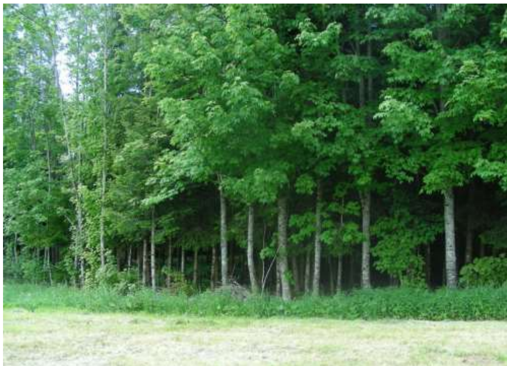
Bild 24: Eine Baumreihe mit Ahorn ( Acer pseudoplatanus) und Buche ( Fagus sylvatica) mit mehreren Vorkommen von Rogers Goldhaarmoos ( Orthotrichum rogeri) [1387] am Rand des Naturschutzgebiets „Tiefenhäuser Moos“ in der Gemeinde Höchenschwand.