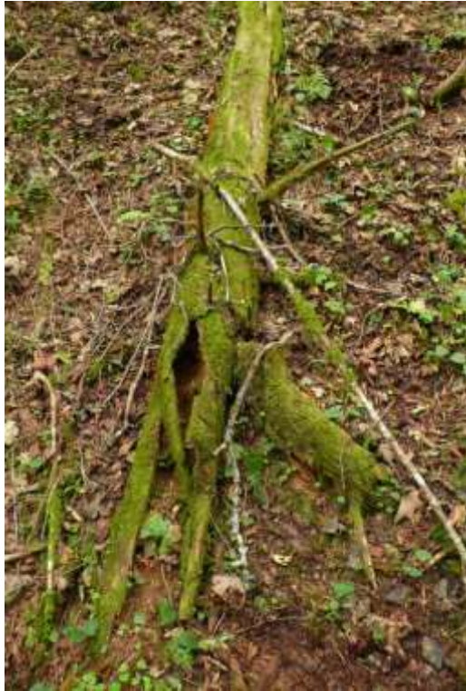
Bild 21: Eine Trägerstruktur des Grünen Koboldmooses ( Buxbaumia viridis ) [1386] am Albufer bei Bantlisloch.