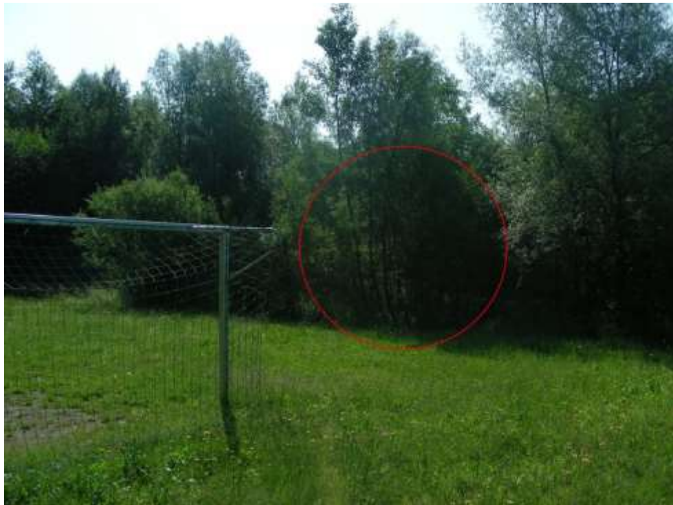
Bild 23: Das Vorkommen von Rogers Goldhaarmoos ( Orthotrichum rogeri) [1387] auf einer Bruchweide (Bildmitte) am Rand eines Bolzplatzes bei Grunholz, Gemeinde Laufenburg.