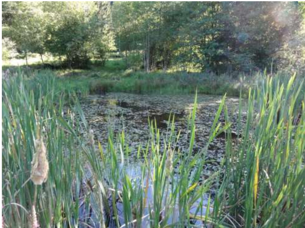
Bild 1: Lebensraumtyp Natürliche nährstoffreiche Seen [3150] mit Schwimmendem Laichkraut ( Potamogeton natans ) im Naturschutzgebiet Mühlbachtal nördlich Hochsal.