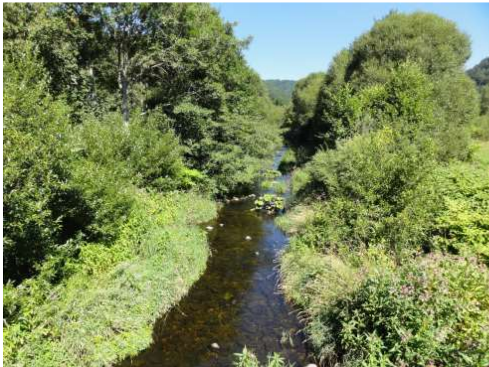
Bild 18: Lebensraumtyp Auenwald mit Erle, Esche, Weide [91E0*] entlang der Alb bei Albtal-Immeneich. 16.08.2013