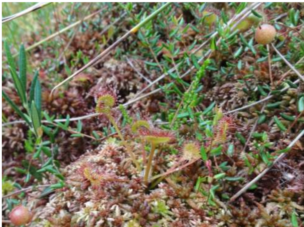
Bild 12: Zu den kennzeichnenden Arten der Naturnahen Hochmoore [7110*] zählen Rundblättriger Sonnentau ( Drosera rotundifolia ), das Mittlere Torfmoos ( Sphagnum magellanicum ) und Gewöhnliche Moosbeere ( Vaccinium oxycoccos ).