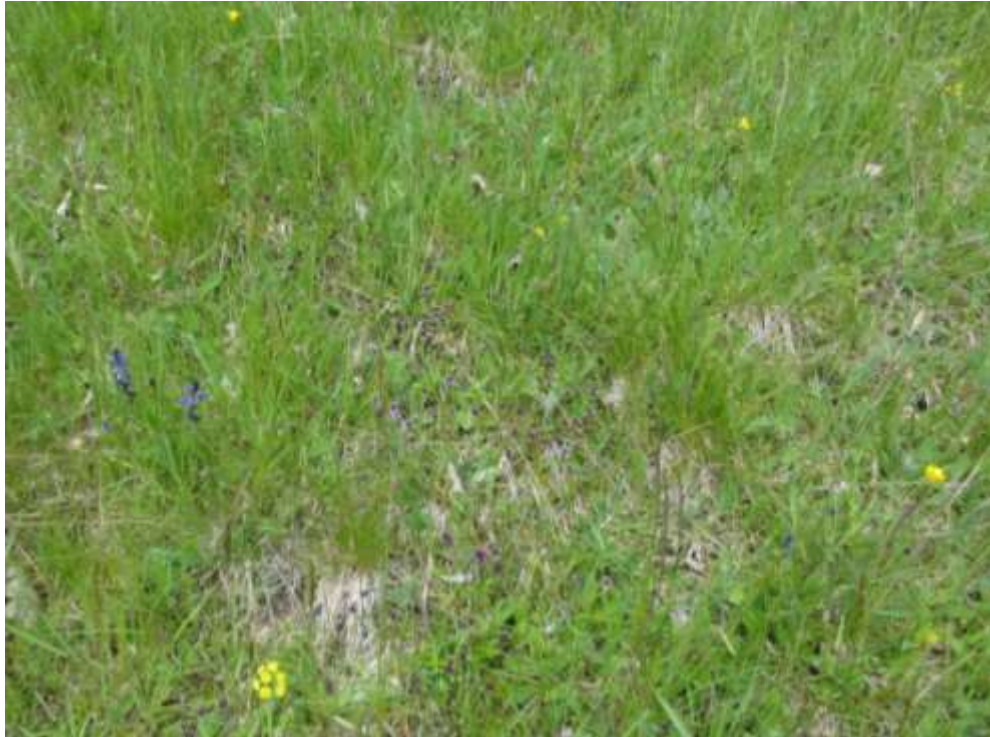
Bild 5: Artenreiche Borstgrasrasen [6230*] sind nur sehr vereinzelt, wie hier westlich Immeneich vorhanden. Kennzeichnend ist die Gewöhnliche Kreuzblume ( Polygala vulgaris ).