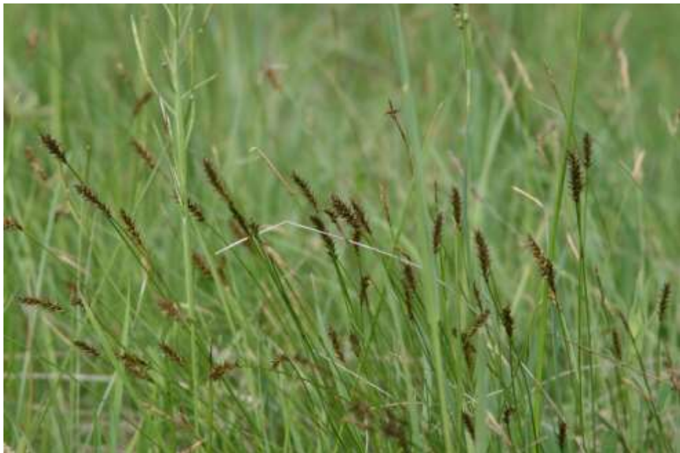
Bild 14: Der Lebensraumtyp Kalkreiche Niedermoore [7230] ist im FFH-Gebiet als Davallseggen-Ried mit der gefährdeten Davalls Segge ( Carex davalliana ) ausgebildet. Der Lebensraumtyp ist nur sehr kleinflächig im NSG „Mühlbachtal“ vorhanden.