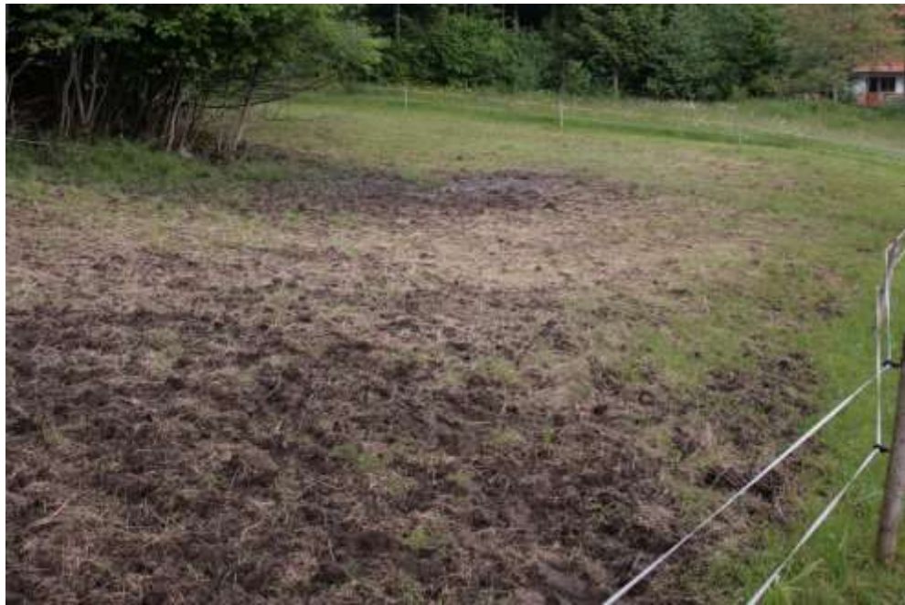
Bild 9: Wie in Bild 8 zu sehen, kann das Artenspektrum des Lebensraumtyps Magere Flachland-Mähwiesen [6510] auch durch eine Beweidung mit Weidepflege erhalten werden. Zu lange Bestoßzeiten können jedoch starke Narbenschäden verursachen (Verlustfläche).