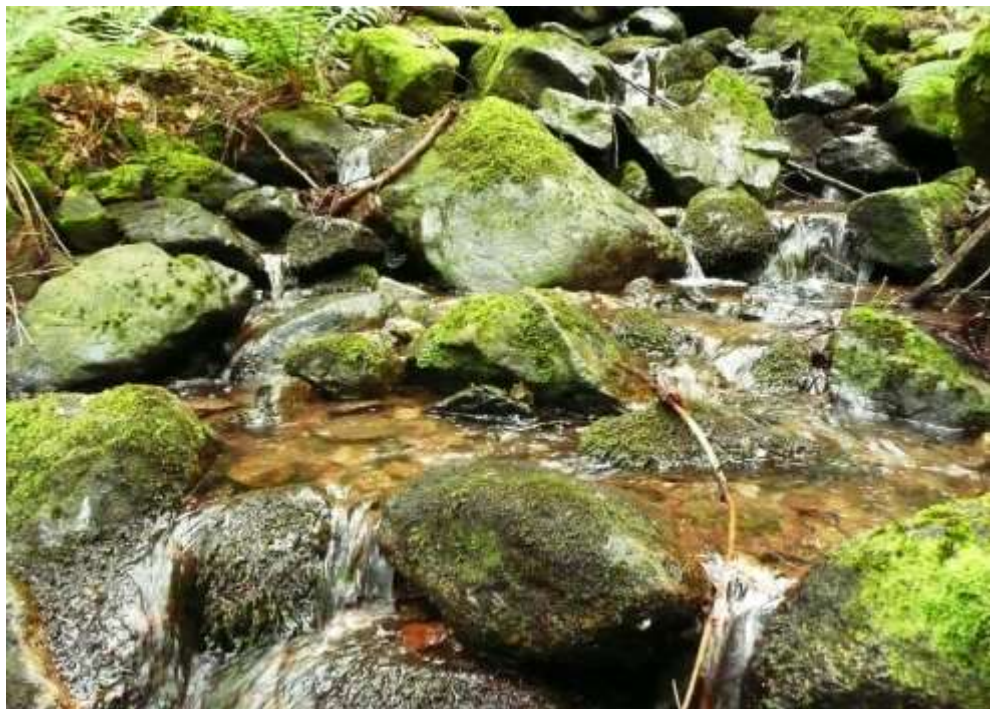
Bild 2: Der Lebensraumtyp Fließgewässer mit flutender Wasservegetation [3260] ist vor allem durch Moosarten charakterisiert.