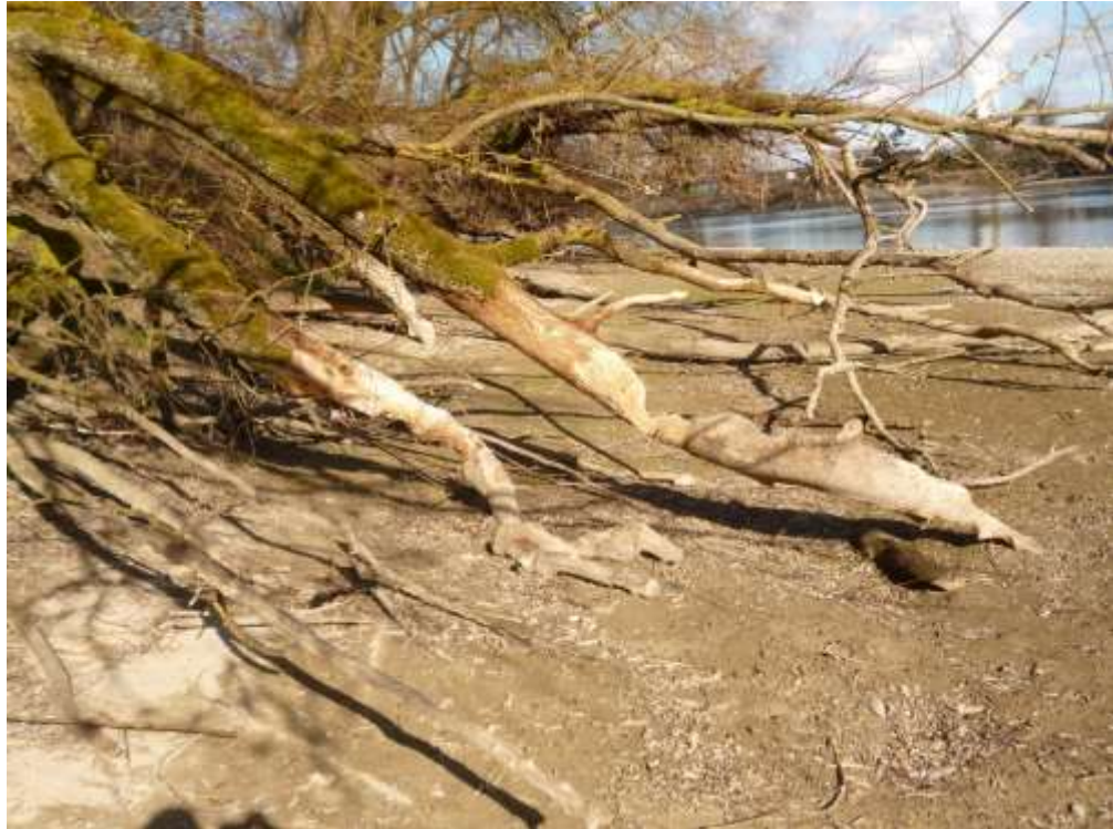
Bild 29 Vom Biber ( Castor fiber ) [1337] gefällte Weiden im Teilgebiet Rheininsel. Im Vordergrund sind deutliche Nagespuren zu erkennen.