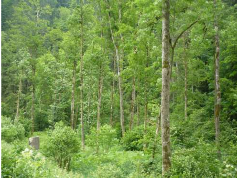
Bild 19: Lebensraumtyp Auenwälder mit Erle, Esche, Weide [91E0*] innerhalb des Waldes.