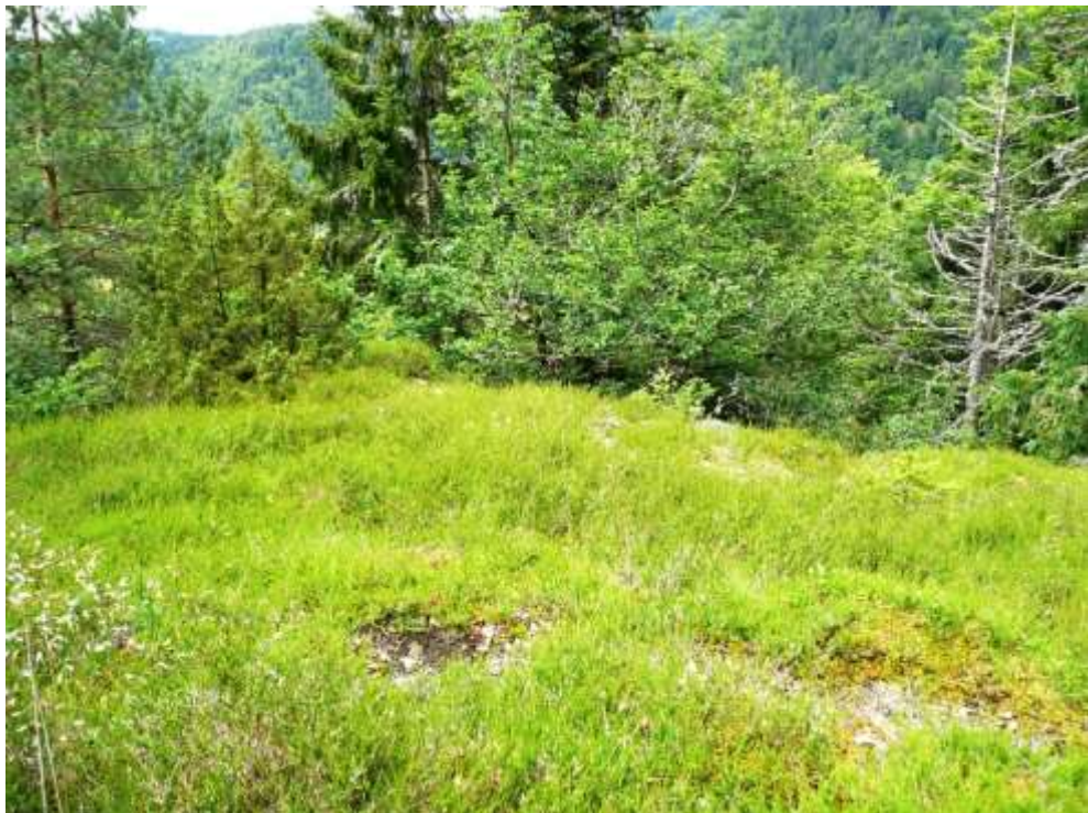
Bild 4: Lebensraumtyp Trockene Heiden [4030] im Wald. Zu den charakteristischen Arten zählen u.a. Heidekraut ( Calluna vulgaris ) und Draht-Schmieie ( Deschampsia flexuosa ).