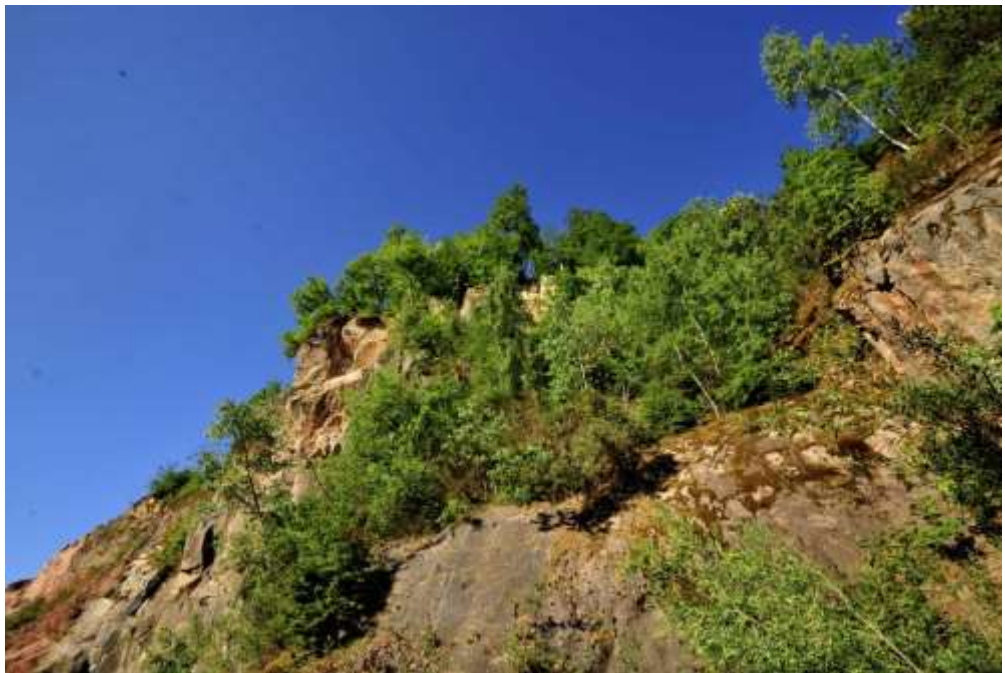
Bild 26: Berglaubsänger ( Phylloscopus bonelli ) [A313] im Albtal beim Tiefensteiner Steinbruch: Die Brut erfolgte hier unter einer umgestürzten Kiefer in einem Gelände mit rissiger Felsstruktur fast ohne Gras mit viel Moos- und Flechtenbewuchs.