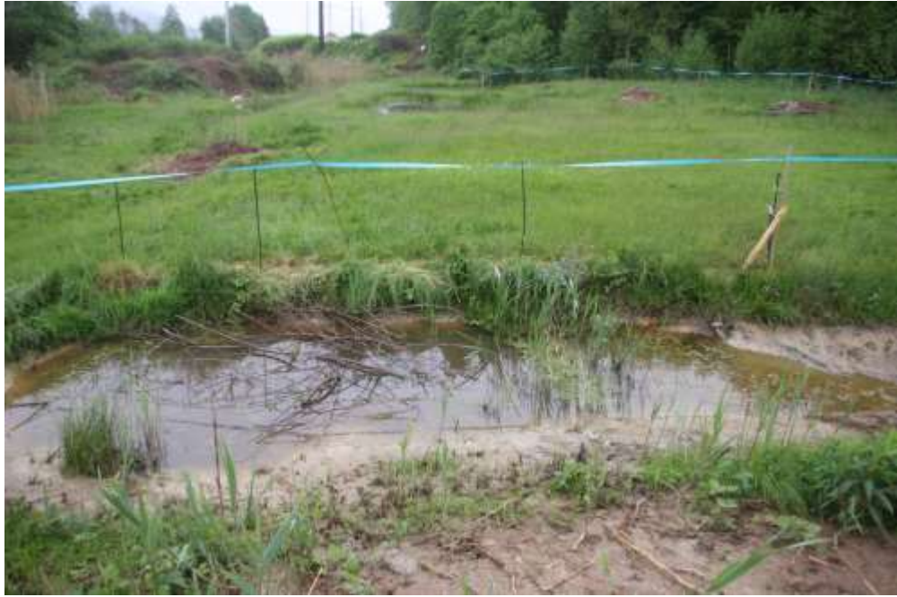
Bild 31 Laichgewässer der Gelbbauchunke ( Bombina variegata) [1193] im Teilgebiet Luttingen.