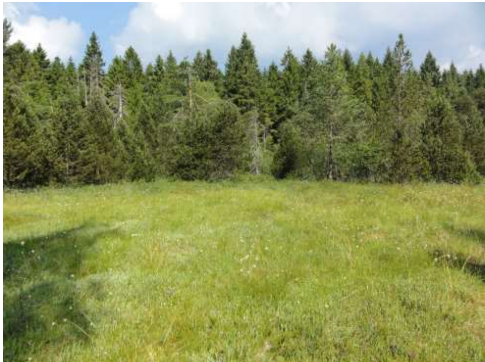
Bild 11: Lebensraumtyp Naturnahe Hochmoore [7110*] im Naturschutzgebiet „Tiefenhäuser Moos“. Im Hintergrund sind die Moorwälder [91D0*] des NSG erkennbar.