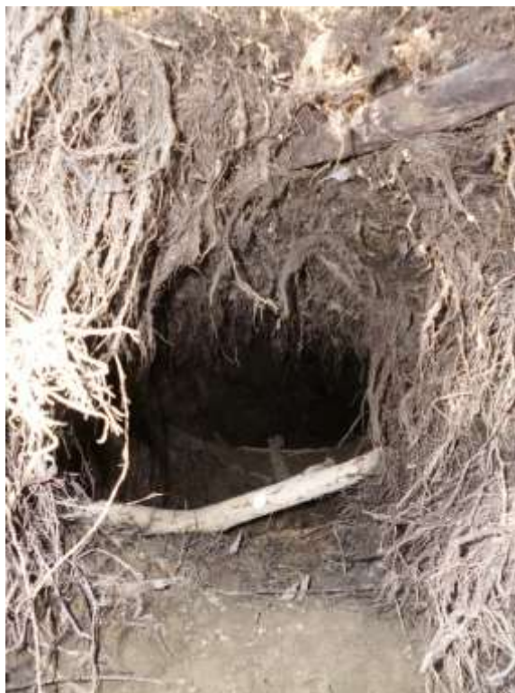
Bild 30 Durch Niedrigwasser des Rheins freigelegter Eingang zum Erdbau eines Bibers ( Castor fiber ) [1337].