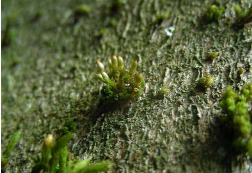
Bild 25: Ein Polster von Rogers Goldhaarmoos ( Orthotrichum rogeri ) [1387] auf einem Ahorn beim NSG „Tiefenhäuser Moos“.