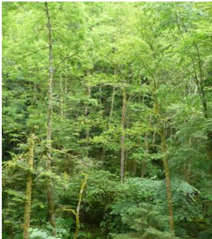
Bild 16: Der Lebensraumtyp Schlucht- und Hangmischwälder [9180*] nimmt im FFH-Gebiet 37,6 ha ein und konzentriert sich im Wesentlichen auf das Albtal südlich Wilfingen.