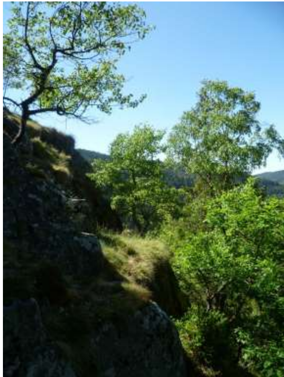
Bild 28: Berglaubsänger ( Phylloscopus bonelli ) [A313] im Oberen Albtal östlich Höchenschwand. Lebensstätte, aktuell ohne Revier vom Berglaubsänger ( Phylloscopus bonelli ) [A313].