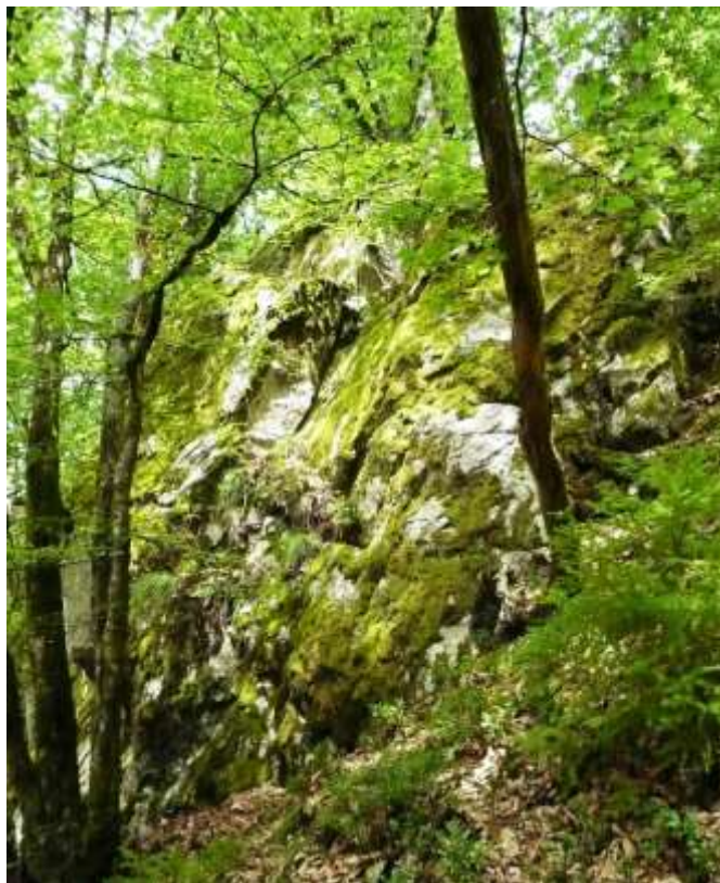
Bild 16: Der etwas stärker beschattete Felsen im Wald entspricht dem Lebensraumtyp Silikatfelsen mit Felsspaltenevegetation [8220].