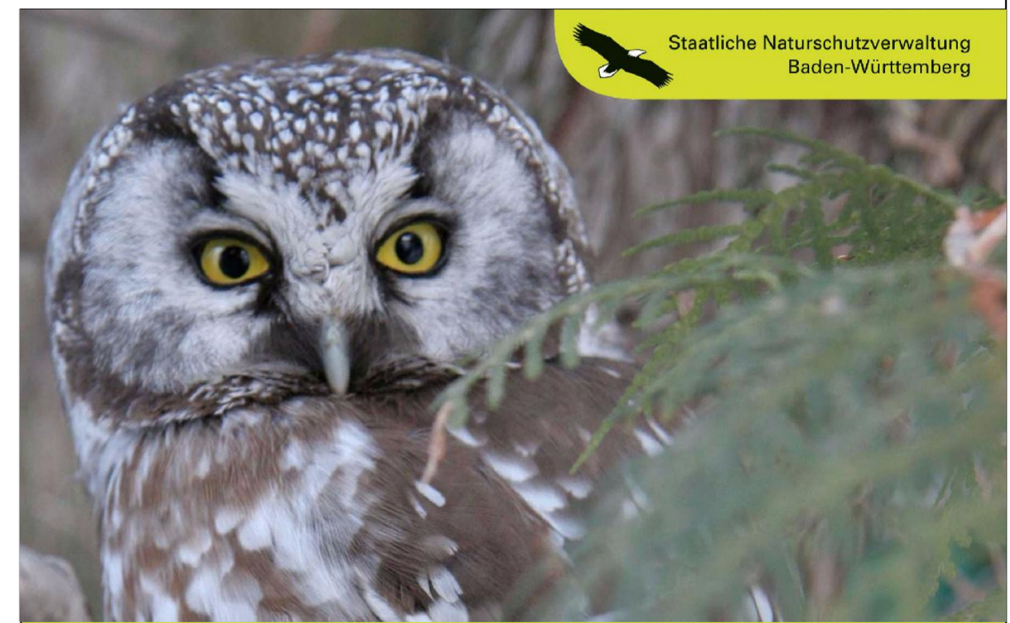
Staatliche Naturschutzverwaltung Baden-Württemberg

Pflege- und Entwicklungsplan für das FFH-Gebiet 7914-341 "Rohrhardsberg, Obere Elz und Wilde Gutach" und das SPA 7814-401 "Simonswald-Rohrhardsberg" (Teilgebiet)