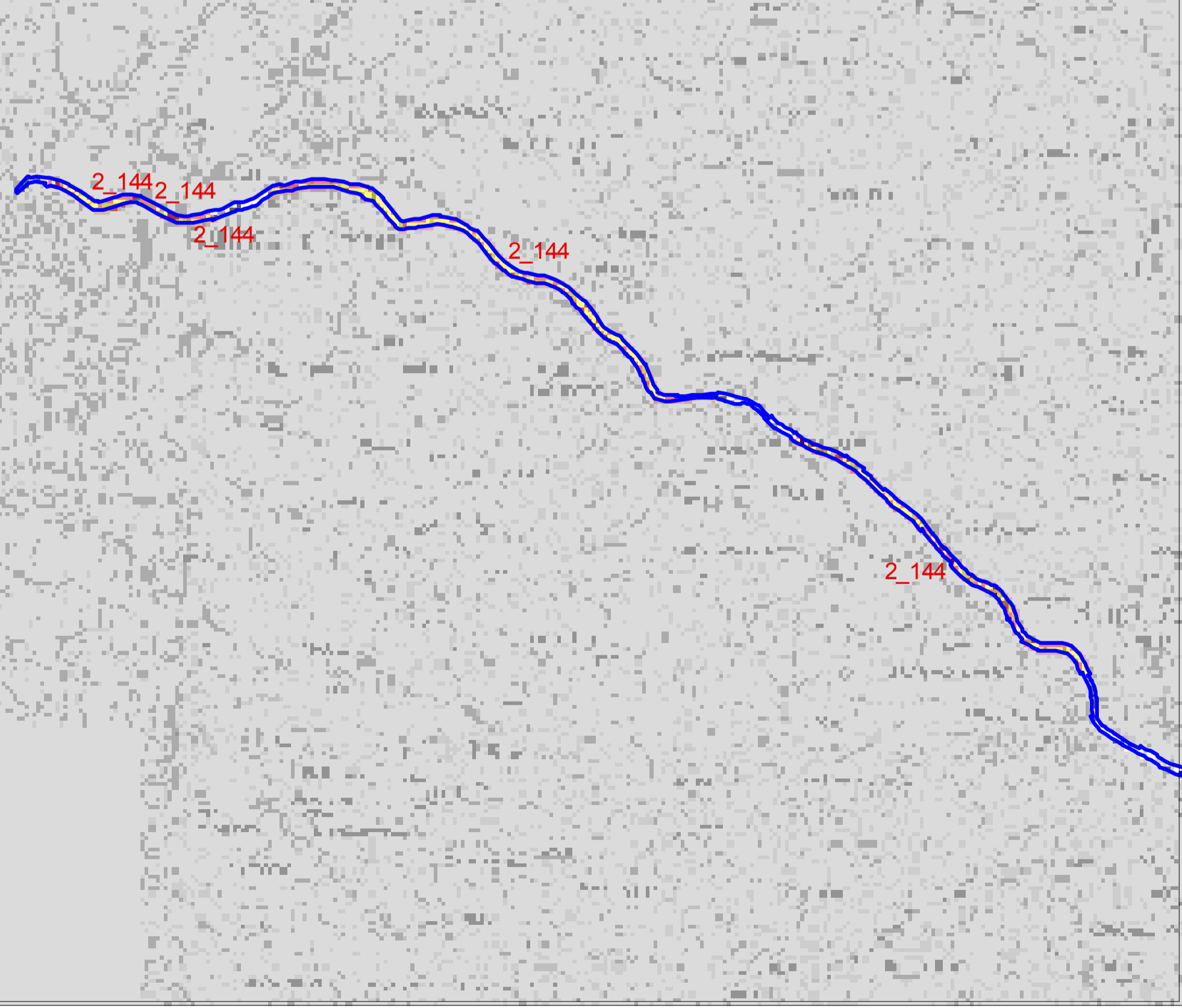
Detailldarstellung 3 (Gebiet Niederbrücke/ Bleibach) (Maßstab 1:20.000)