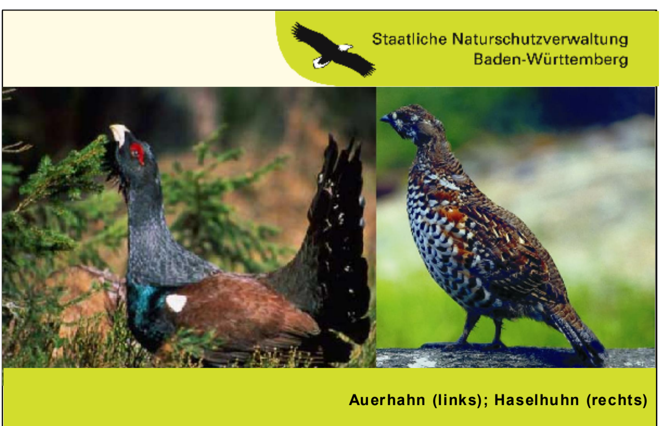
Pflege- und Entwicklungsplan für das FFH-Gebiet 7914-401 "Rohrhardsberg, Obere Elz und Wilde Gutach" und das SPA 7814-401 "Simonswald-Rohrhardsberg" (Teilgebiet)