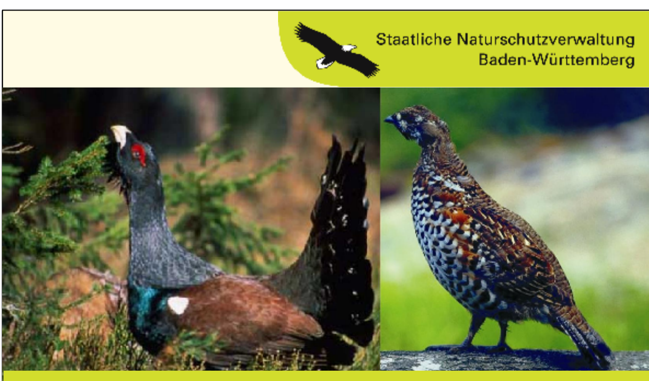
Pflege- und Entwicklungsplan für das FFH-Gebiet 7914-401 "Rohrhardsberg, Obere Elz und Wilde Gutach" und das SPA 7814-401 "Simonswald-Rohrhardsberg" (Teilgebiet)