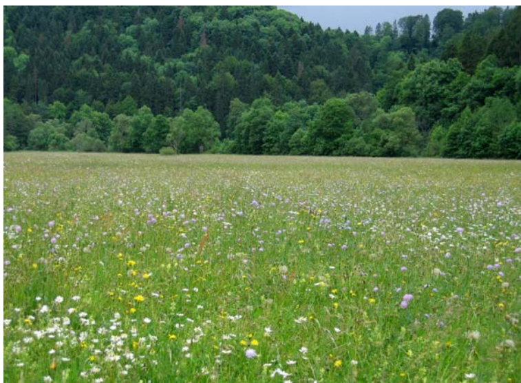
Bild 9: NSG Schlichemtal (LRT 6510 Magere Flachlandmähwiese).