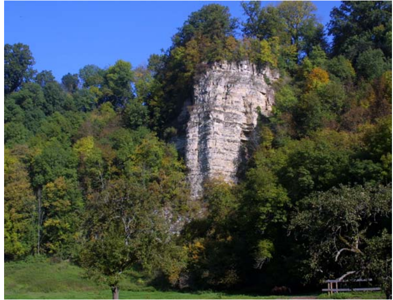
Bilder 10 und 11: Schlichemtal beim Butschhof (LRT 8210 Felsen mit Felsspaltенvegetation).