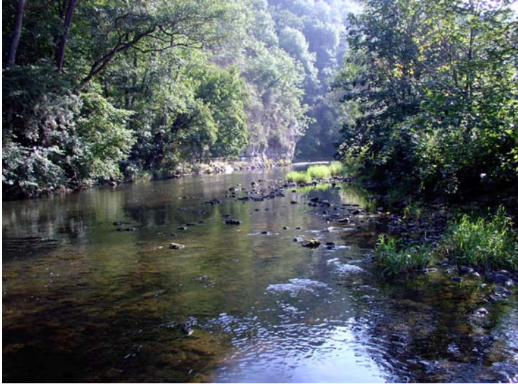
Bild 1: Neckar bei der Neckarburg (LRT 3260 Fließgewässer mit flutender Wasservegetation). Roland Marthaler, Oktober 2005.