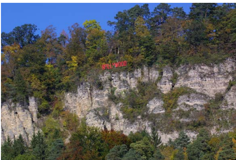
Bild 13: Boller Halde bei Oberndorf (LRT 8210 Felsen mit Felsspaltенvegetation).