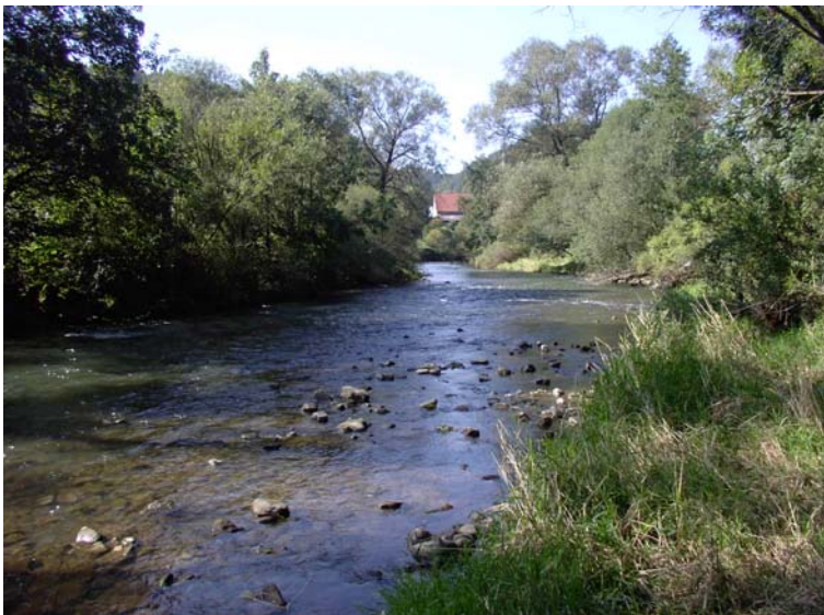
Bild 2: Neckar bei Altoberndorf (LRT 3260 Fließgewässer mit flutender Wasservegetation). Roland Marthaler, Oktober 2005.