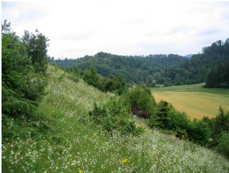
Bild 5: NSG Neckarburg (LRT 5130 Wacholderheide). Frauke Staub, 7.7.2006.