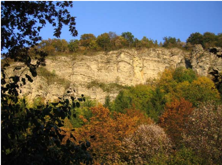
Bild 12: NSG Brandhalde mit Bollerfels (LRT 8210 Felsen mit Felsspaltенvegetation)