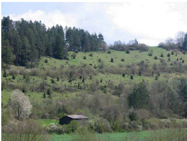
Bild 6: NSG Kälberhalde (LRT 5130 Wacholderheide)