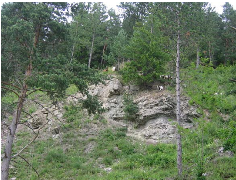
Bild 15: Kapfhalde: Ziegenbeweidung zur Schaffung eines Mosaiks aus Offenland- Lebensraumtypen im Wald. Frauke Staub, 7.7.2005.