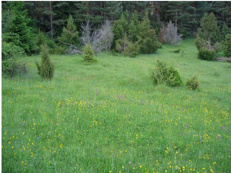
Bild 8: Keltertal (LRT 5130 Wacholderheide)