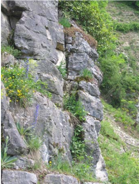
Bild 14: Aspenhalde (LRT 8210 Felsen mit Felsspaltenvegetation).