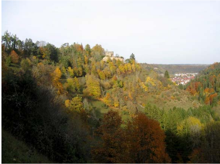
Bild 7: NSG Albeck (LRT 5130 Wacholderheide), 25.10.2005.