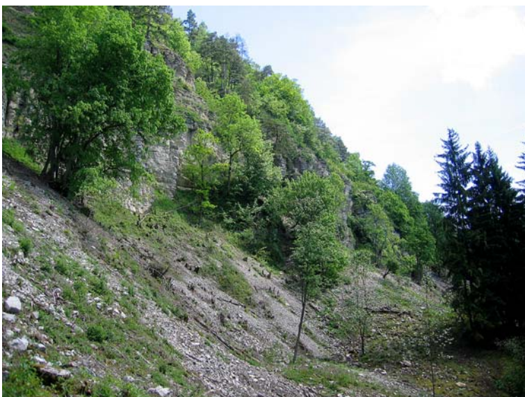
Bild 16: Aspenhalde (LRT 8160* Kalkschutthalden: Gehölzentfernung).