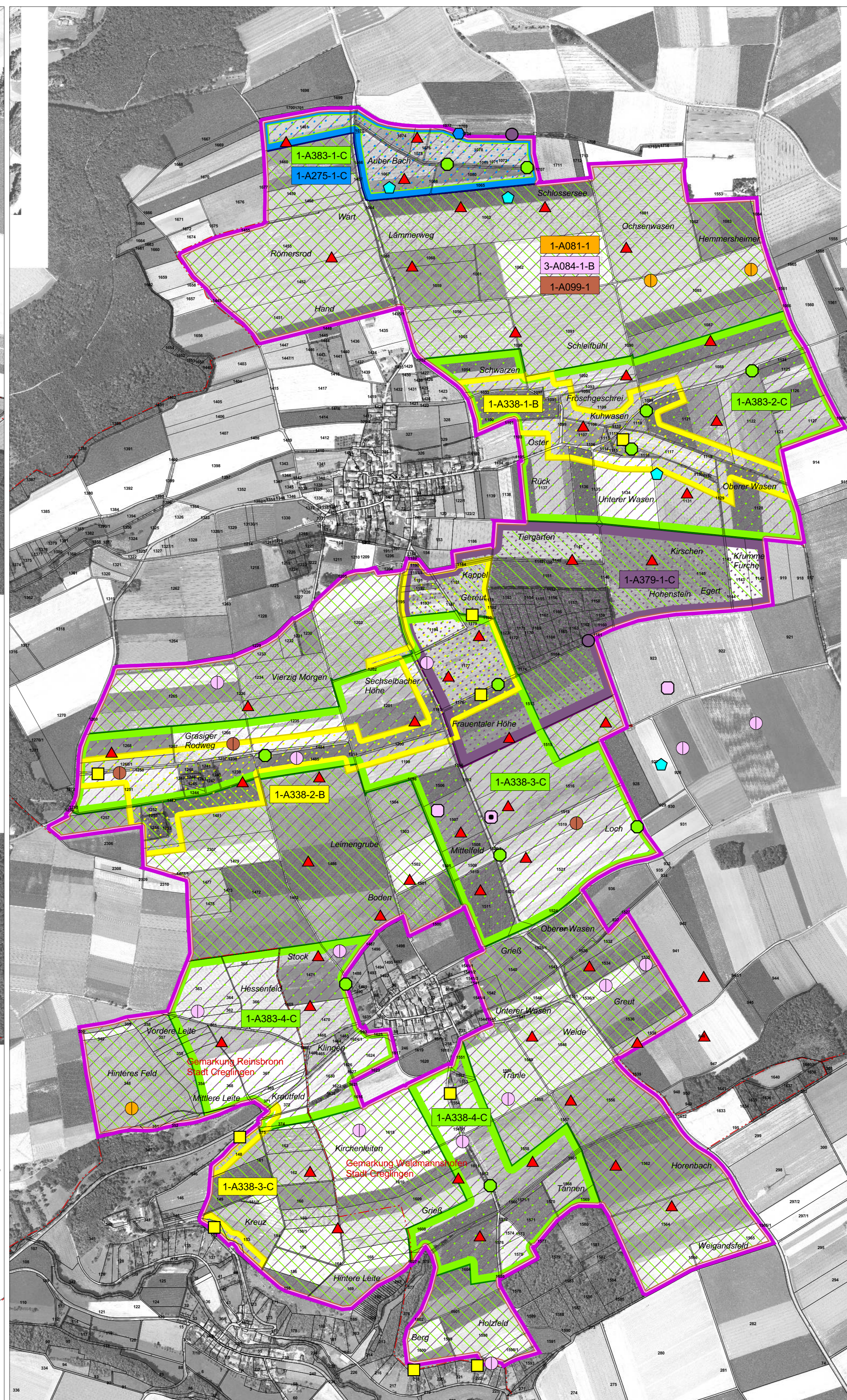
Teilkarte 4: Waldmannshofen