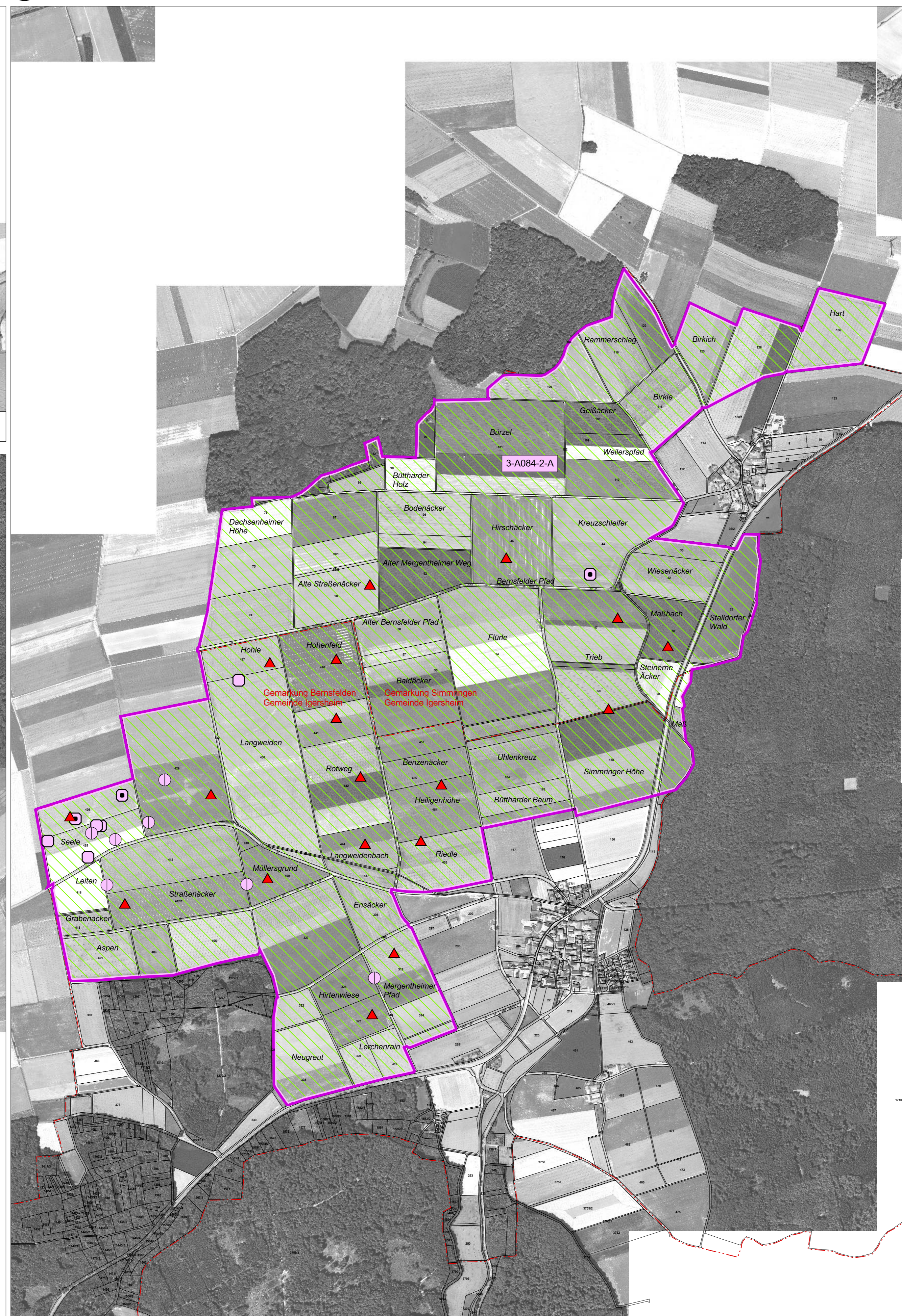
Teilkarte 3: Simmringen