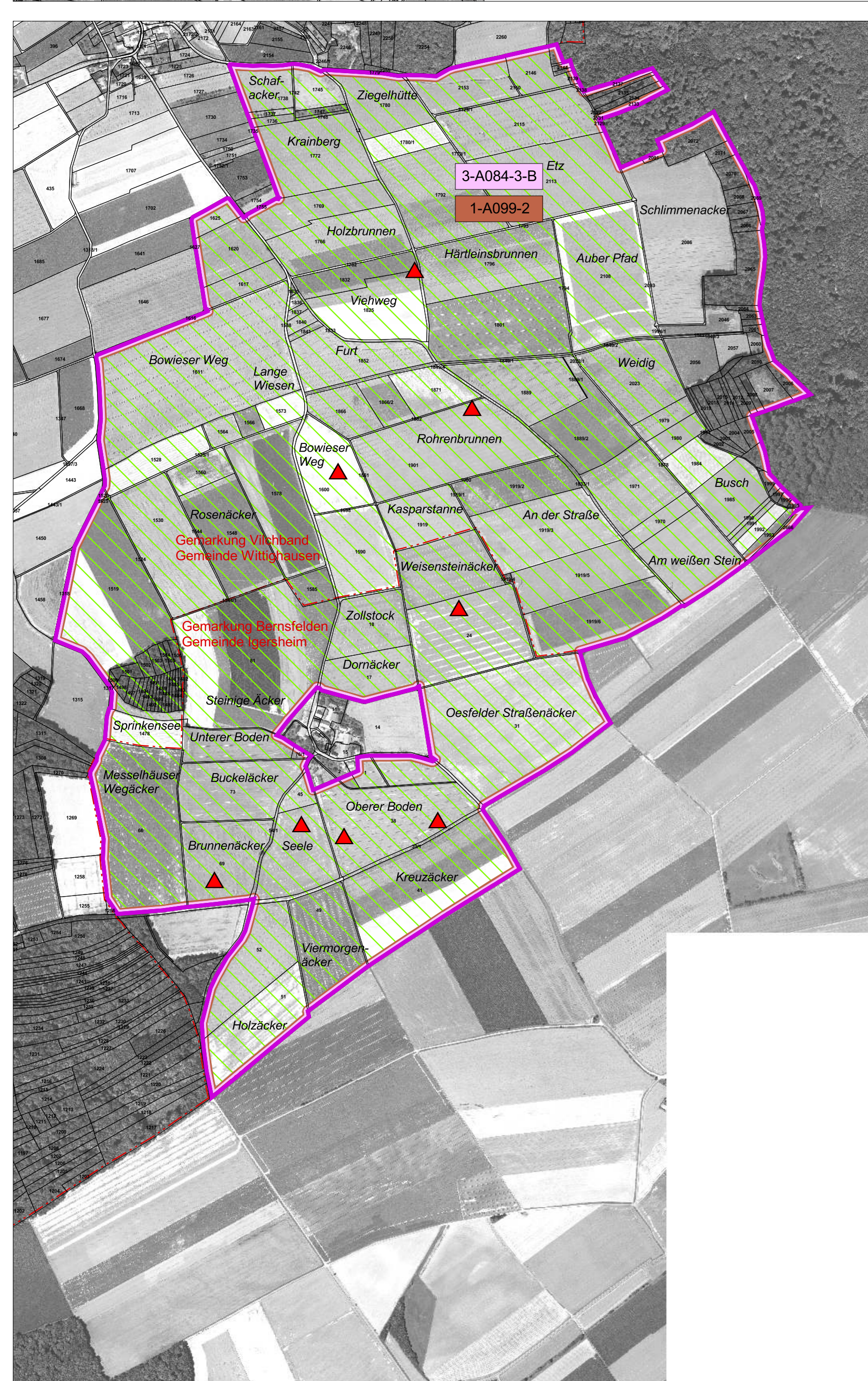
Teilkarte 2: Bowiesen-Vilchband