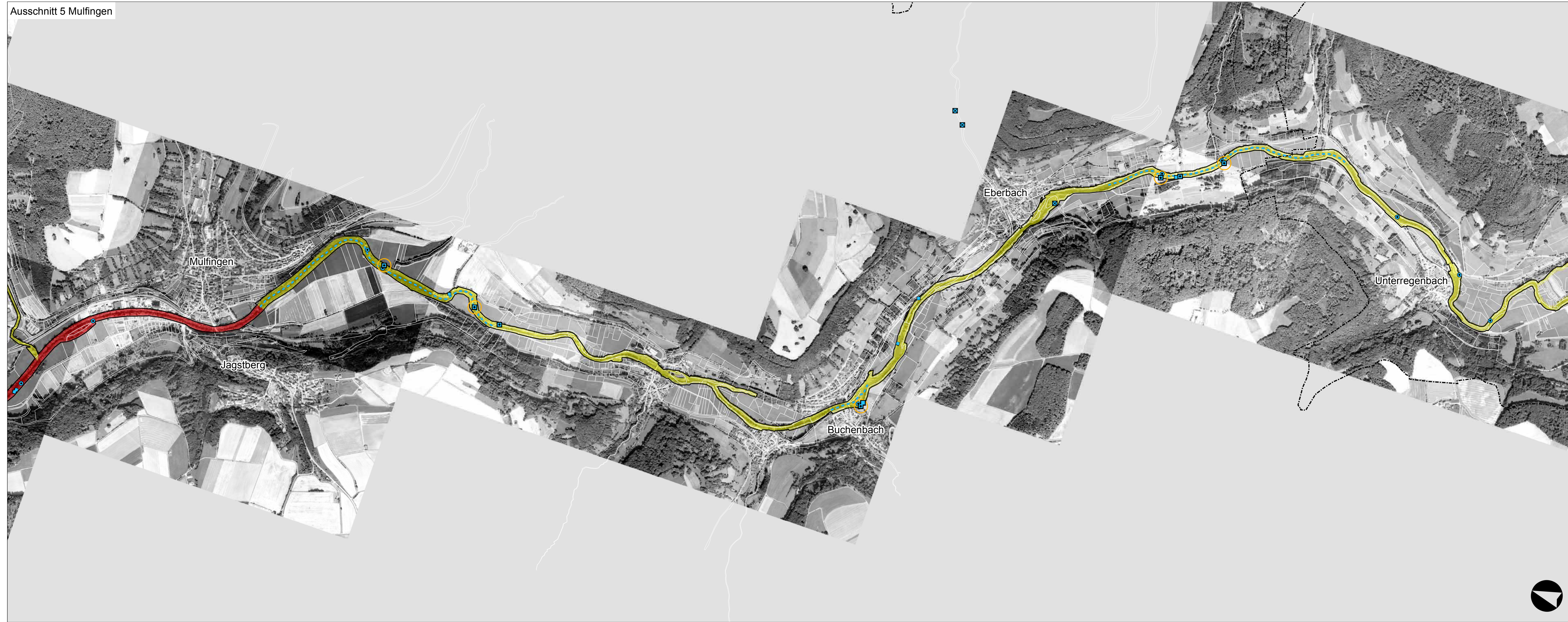
Ausschnitt 5 Mulfingen