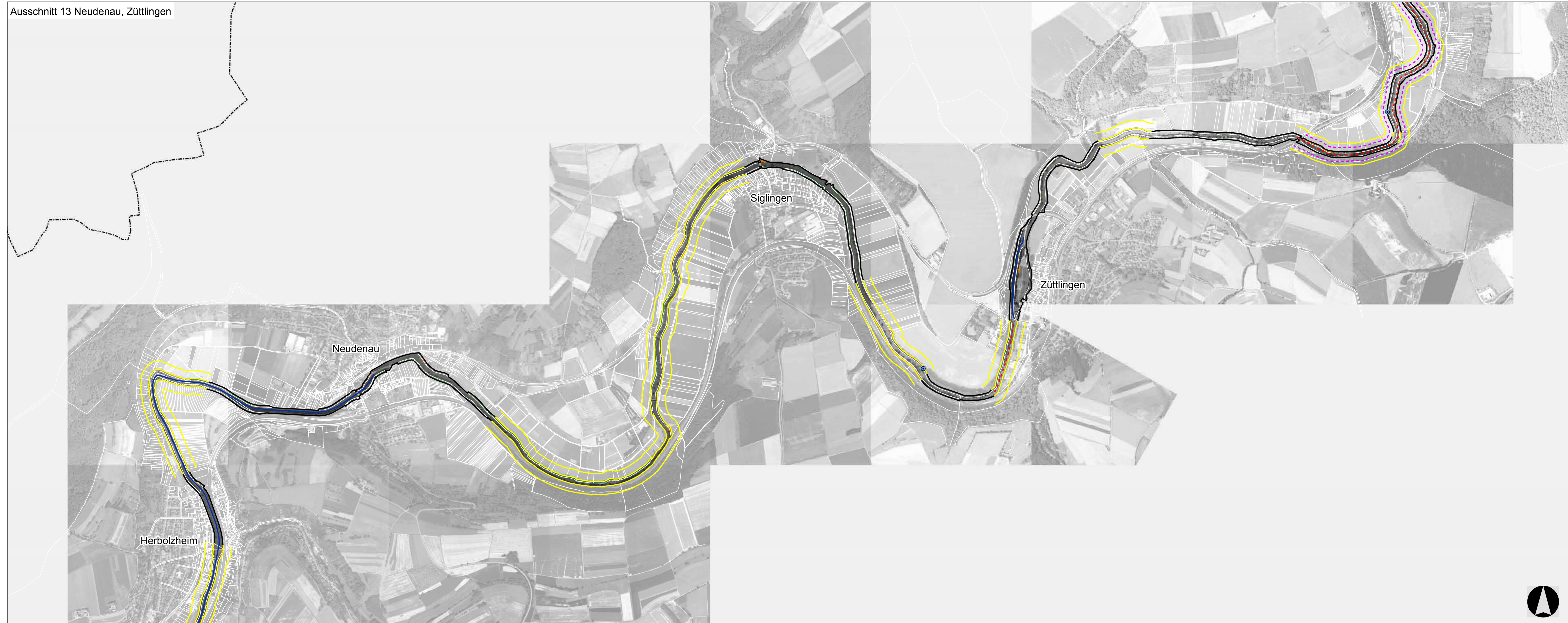
Ausschnitt 13 Neudenu, Züttlingen