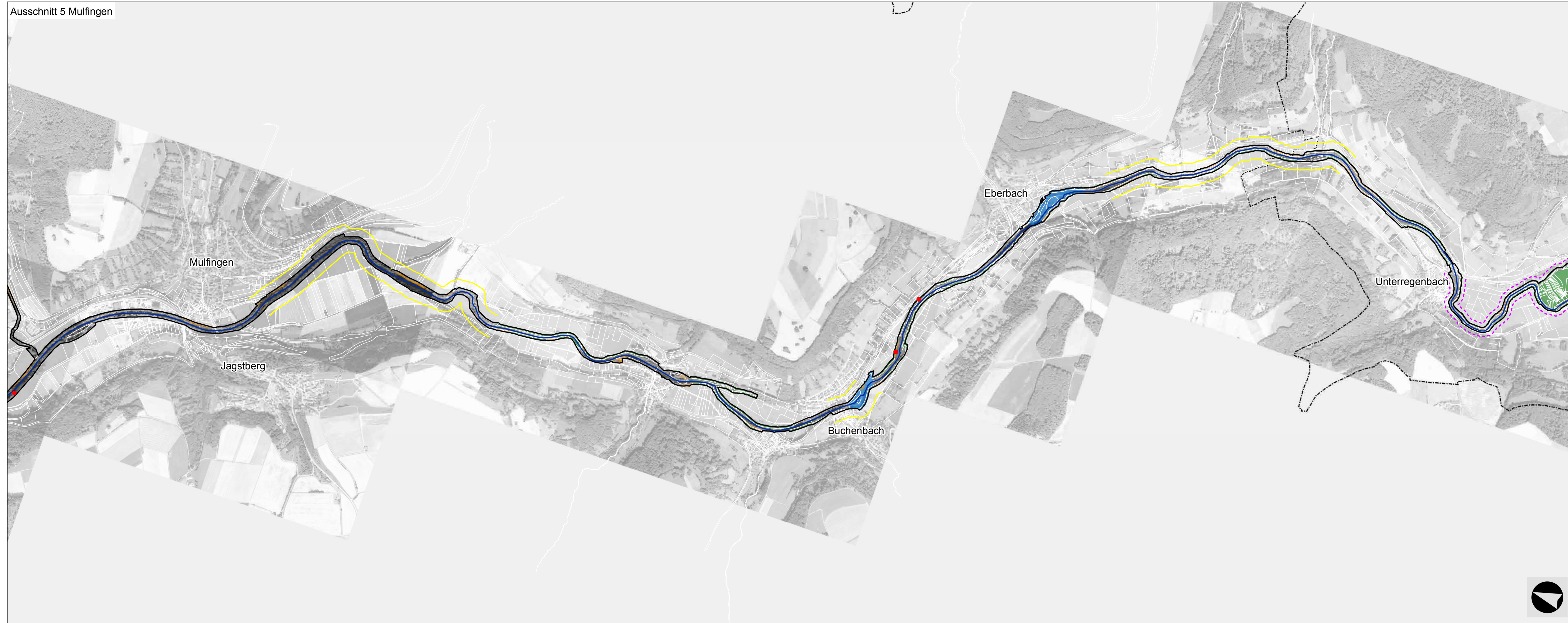
Ausschnitt 5 Mulfingen