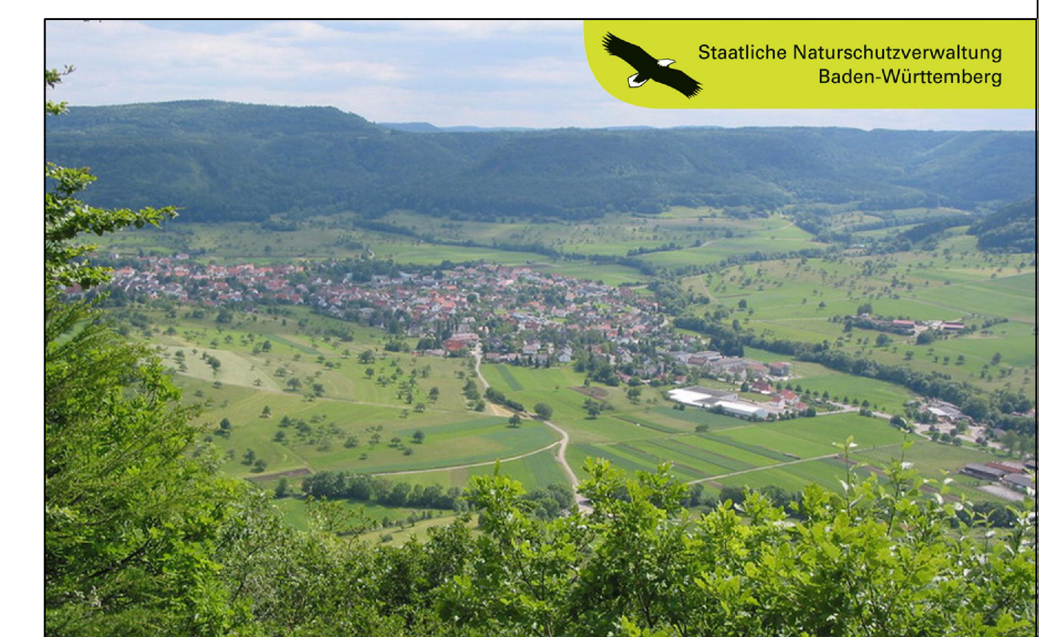
Blick auf Talheim

Pflege- und Entwicklungsplan für das FFH-Gebiet 7620-343 "Albtrauf zwischen Mössingen und Gönningen" und das VS-Gebiet 7422-441 "Mittlere Schwäbische Alb" (Teilbereich)