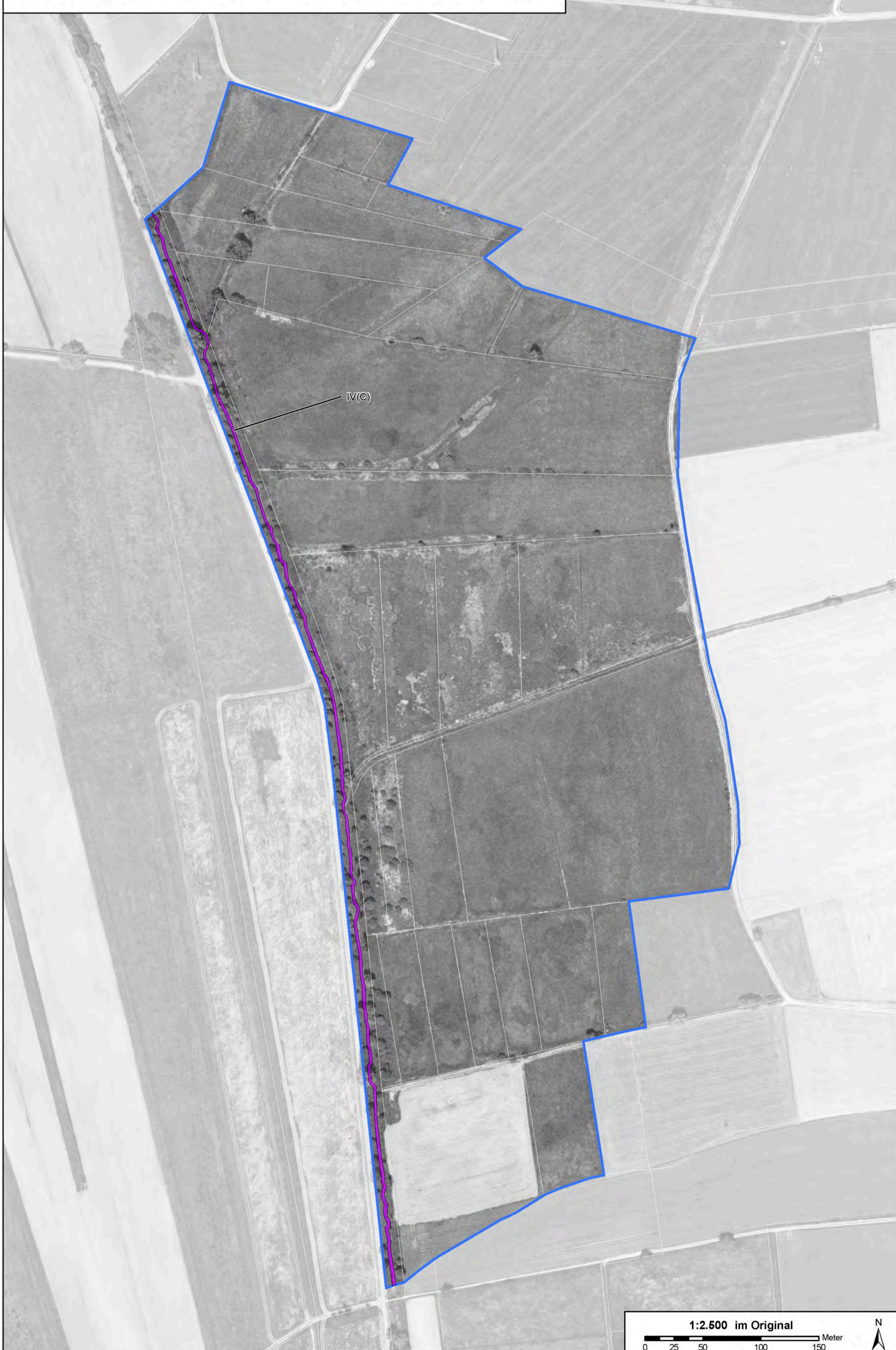
Teilgebiet Schwarzer Graben - Lebensstätten der Arten