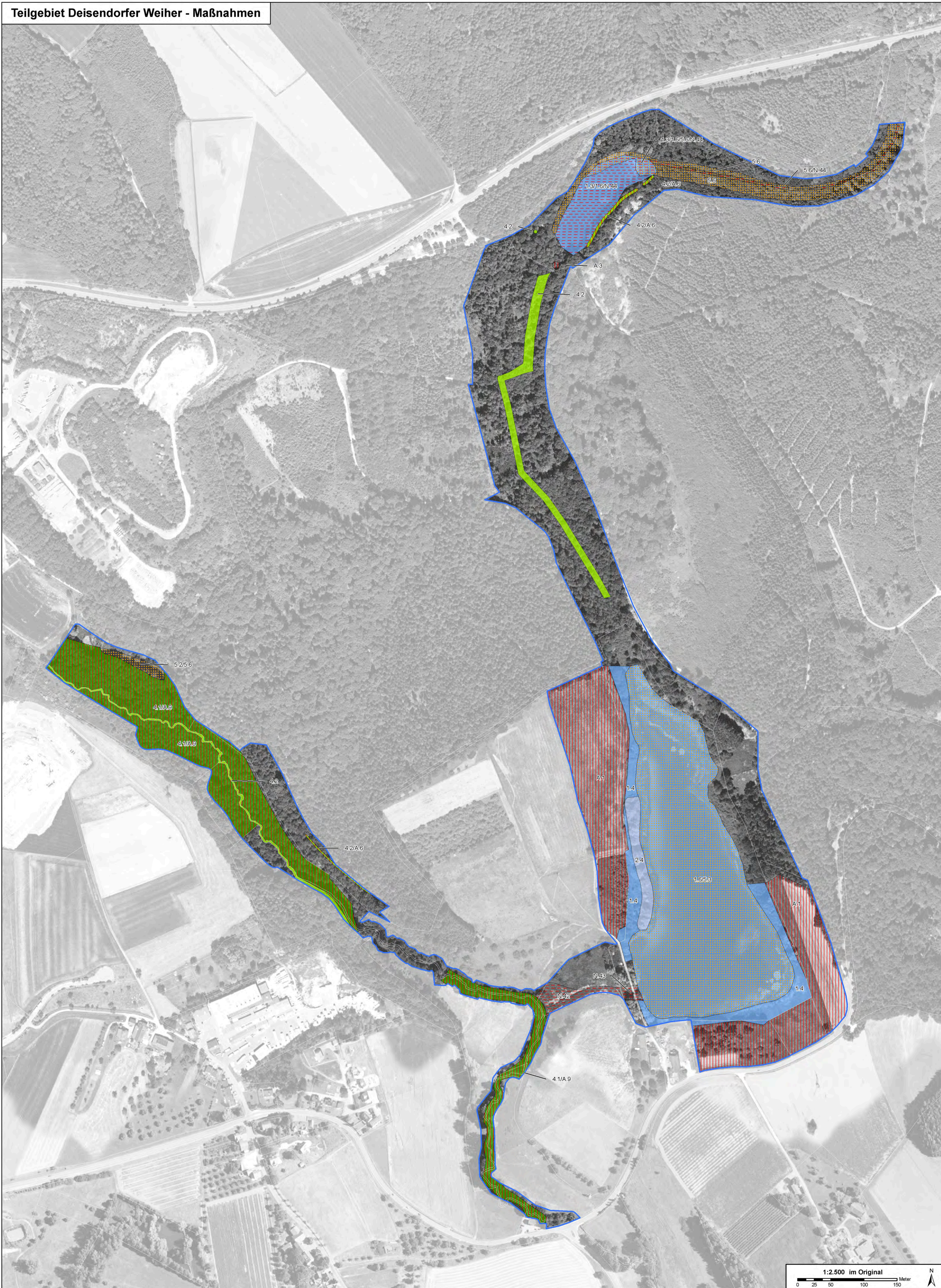
Teilgebiet Deisendorfer Weiher - Maßnahmen