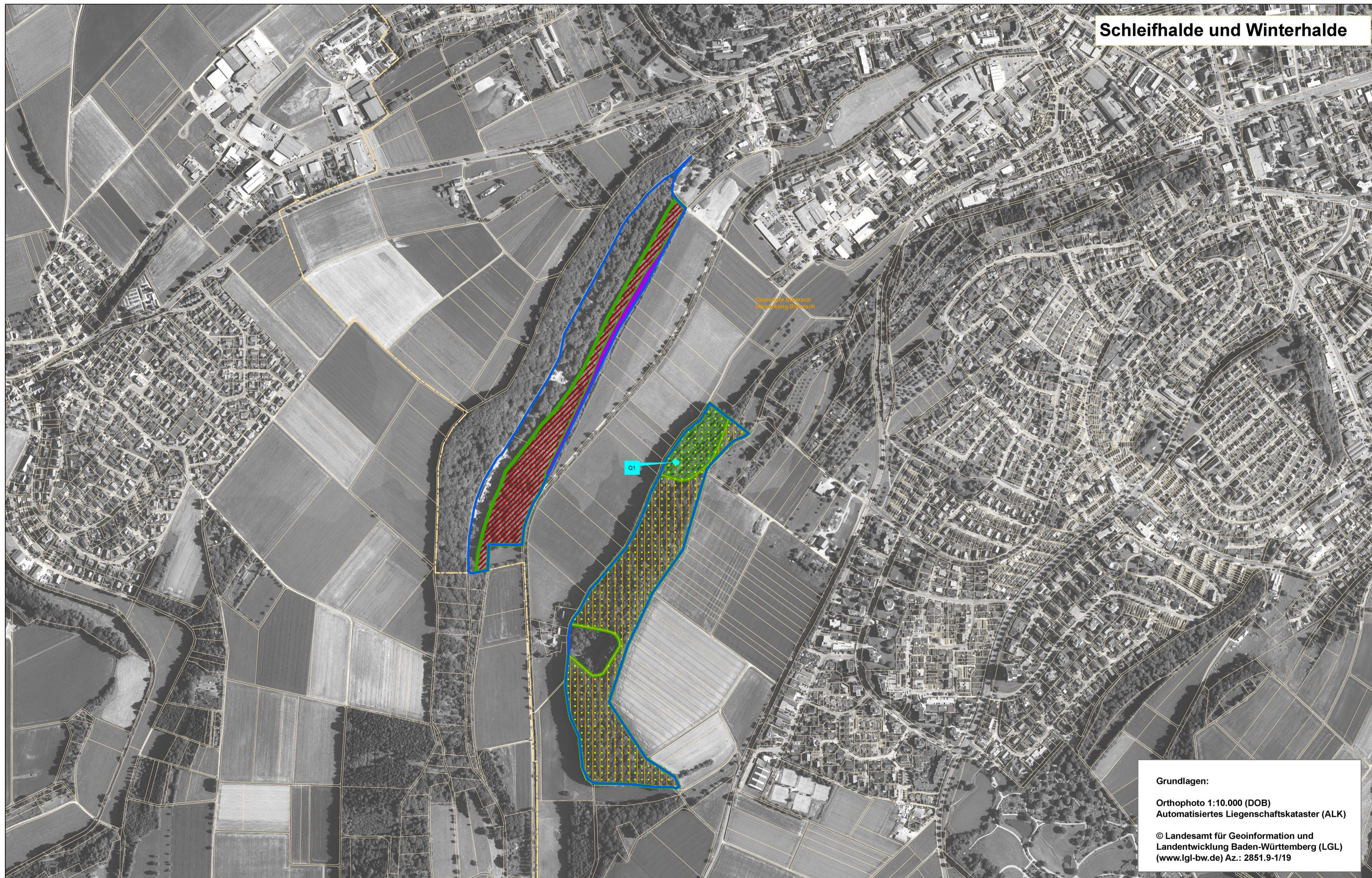
Schleifhalde und Winterhalde