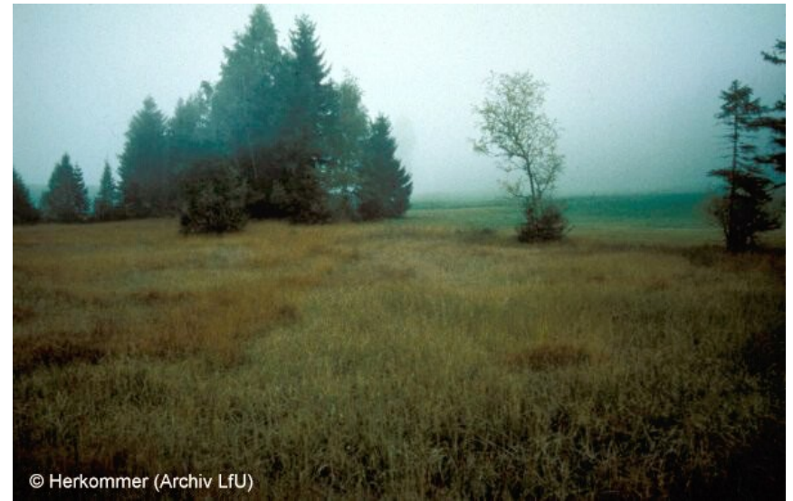
Standörtlicher Übergangsbereich zwischen Hochmoor und waldfreiem Niedermoor mit Mineralbodeneinfluss; auf nassen bis sehr nassen, nährstoffarmen, basenarmen bis basenreichen Standorten.

geschützt nach § 32 NatSchG 1.1 Moore FFH 7140 Übergangs- und Schwingrasenmoore FFH 7150 Torfmoor-Schlenken * Prioritärer Lebensraum