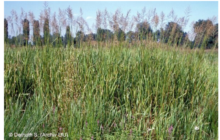
Bestände des Großen Wasserschwadens ( Glyceria maxima ). Entlang von Bächen, Flüssen und Gräben mit langsam fließendem, eutrophem Wasser; auch in Flutmulden.

geschützt nach § 32 NatSchG 1.1 Moore, 1.2 Sümpfe, 1.7 Röhrichtbestände und Riede, 1.9 Quellbereiche FFH 3150 Natürliche nährstoffreiche Seen