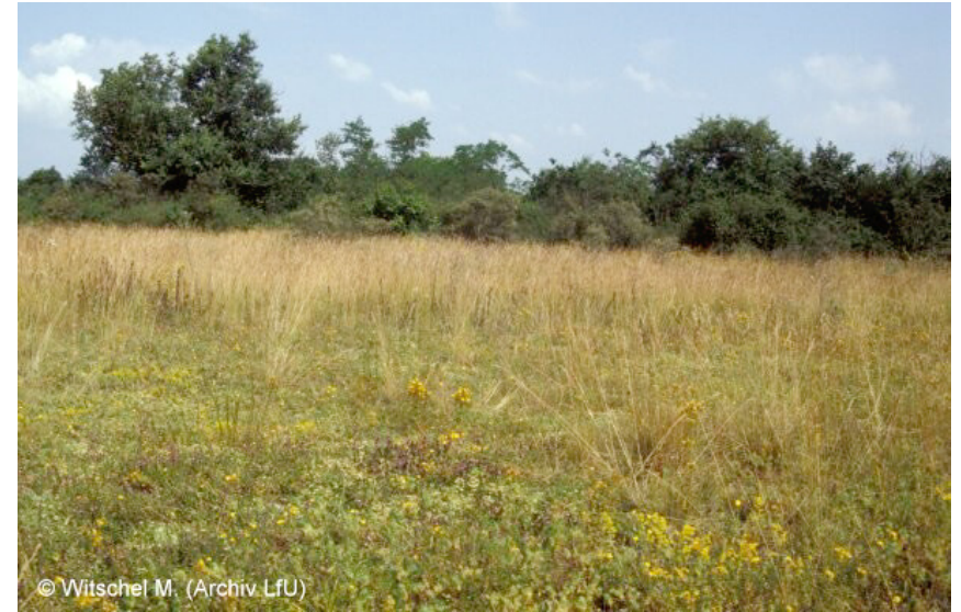
Lückige Rasen aus Magerkeits- und Trockenheitszeigern. Auf trockenen, meist flachgründigen und skelettreichen Standorten, seltener auf Löss, Flugsand oder Kies.

geschützt nach § 32 NatSchG 3.4 Trockenrasen FFH *6110 Kalk-Pionierrasen*, FFH 6210 Kalk-Magerrasen (orchideenreiche Bestände)*, FFH *6240 Subkontinentale Steppenrasen*, FFH 8210 Kalkfelsen mit Felsspaltenvegetation, FFH 8220 Silikafelsen mit Felsspaltenvegetation, FFH 8230 Pionierrasen auf Silikafelskuppen * Prioritärer Lebensraum