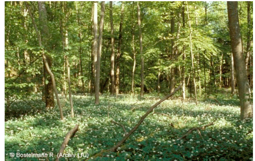
Wald auf quelligen, sickerfeuchten Standorten sowie entlang von Rinn-salen und Bächen.

geschützt nach § 32 NatSchG 1.4 Naturnahe Sumpfwälder § 32 NatSchG 1.5 Naturnahe Auwälder FFH *91E0 Auenwälder mit Erle, Esche, Weide* * Prioritärer Lebensraum