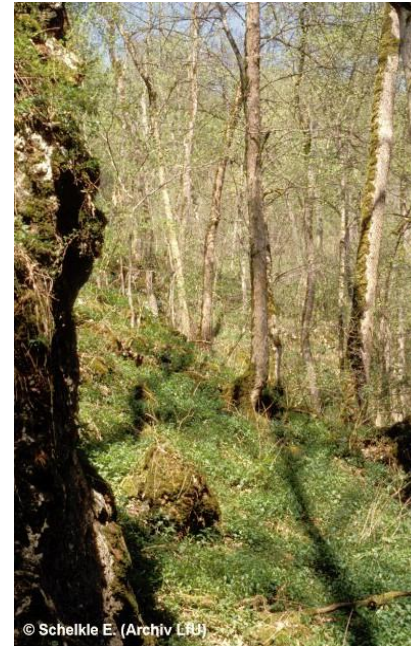
Durch Berg-Ahorn gekennzeichneter Wald auf Blockhalden basenarmer Gesteine, dem Eberesche und regional Tanne beigemischt sind.

geschützt nach § 30 a LWaldG w71 Naturnahe Schlucht-, Blockhalden- und Hangschuttwälder FFH *9180 Schlucht- und Hangmischwälder * Prioritärer Lebensraum