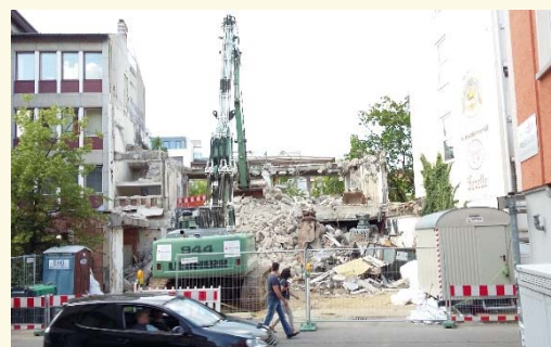
Beispiel für Baustelle mit beengten Verhältnissen