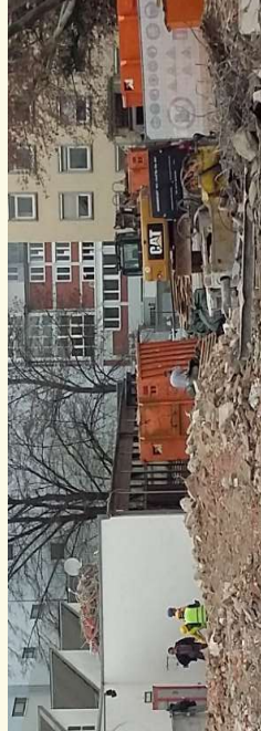
Beton, Ziegel und Metalle