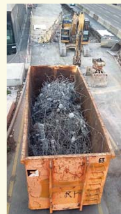
Getrennte Sammlung von Metallen