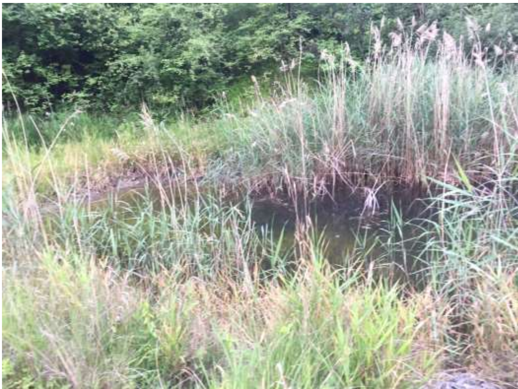
Bild 42: Laichgewässer des Kammolchs im Steinbruch Leimen