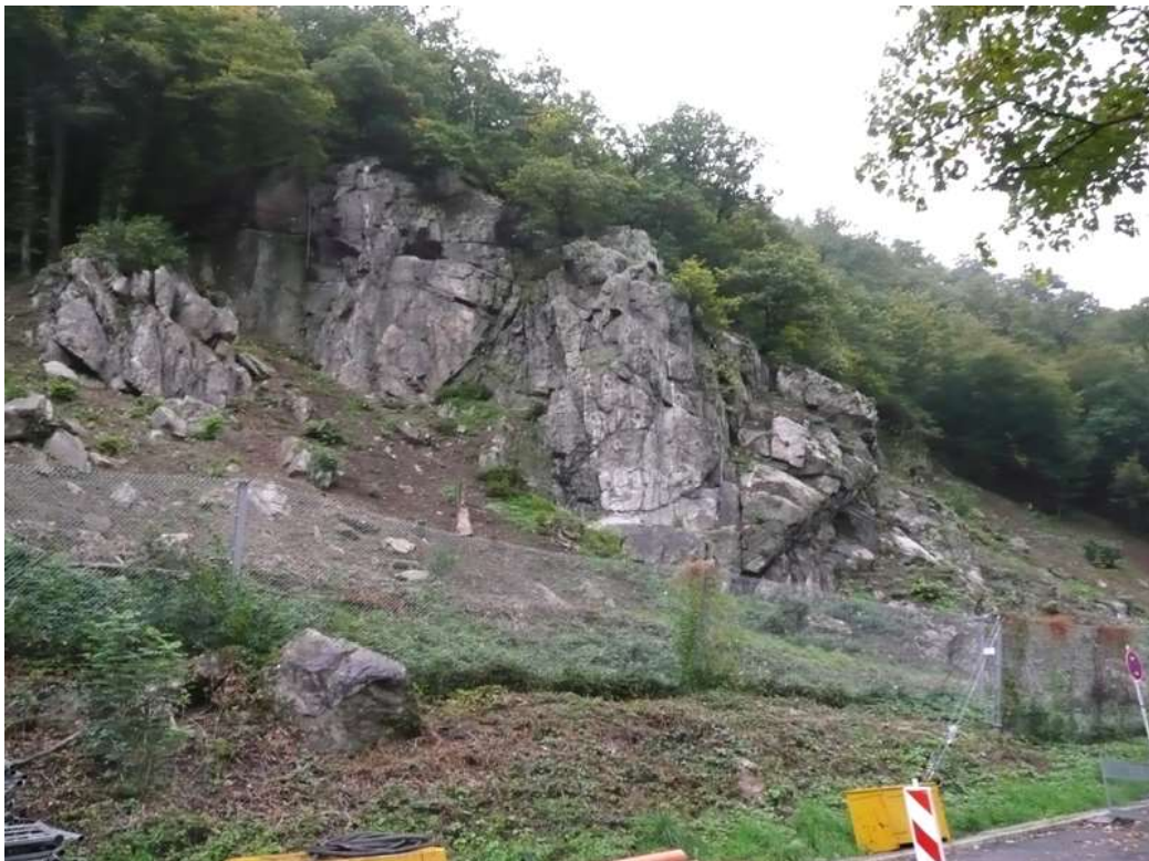
Bild 26: Lebensraumtyp Silikاتفelsen mit Felsspaltvegetation [8220], im Naturschutzgebiet „Russenstein“, freigestellt, 07.09.2010