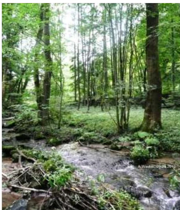
Bild 18: Lebensraumtyp Fließgewässer mit flutender Wasservegetation [3260] und Auwald mit Erle, Esche, Weide [*91E0]