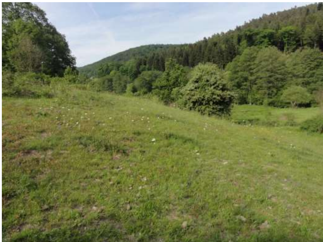
Bild 2: Borstgrasrasen [*6230] im Steinachtal nahe Schönau, 10.05.2011