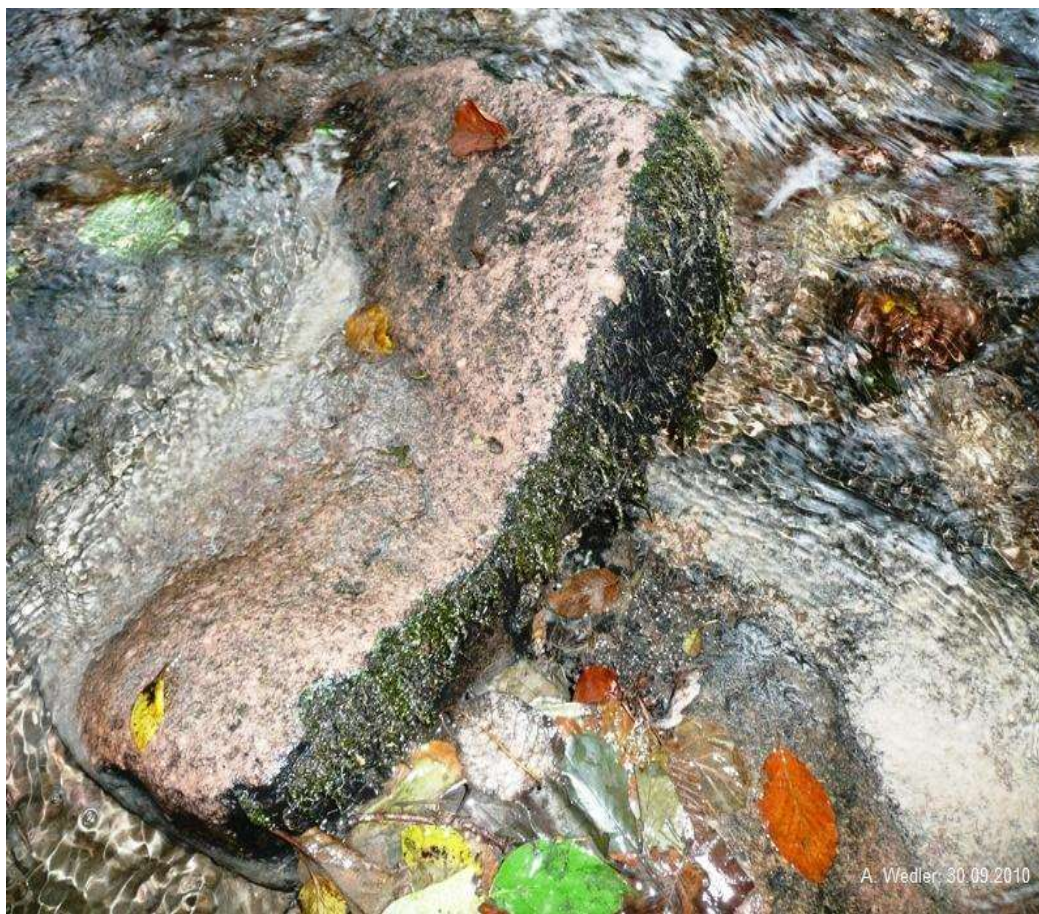
Bild 17: Lebensraumtyp Fließgewässer mit flutender Wasservegetation [3260] mit Ufer-Schnabeldeckelmoos ( Rhynchostegium riparioides), durch unmittelbar vorausgehendes Hochwasser teilweise abrasiert, 30.09.2010