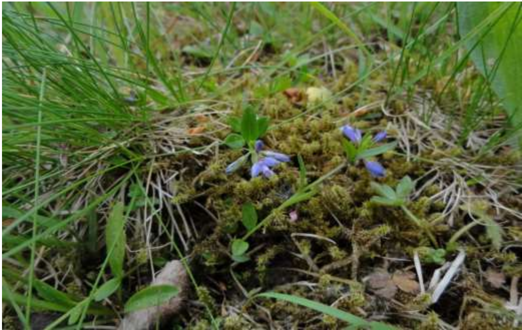
Bild 3: Borstgrasrasen [*6230] mit Polygala serpyllifolia, Schafbachtal, 10.05.2011