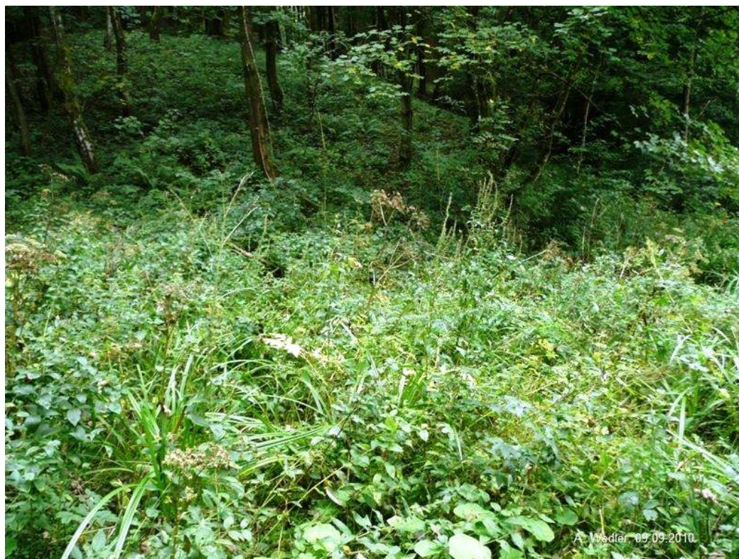
Bild 19: Lebensraumtyp Feuchte Hochstaudenfluren [6431] im Eiterbachtal, 09.09.2010