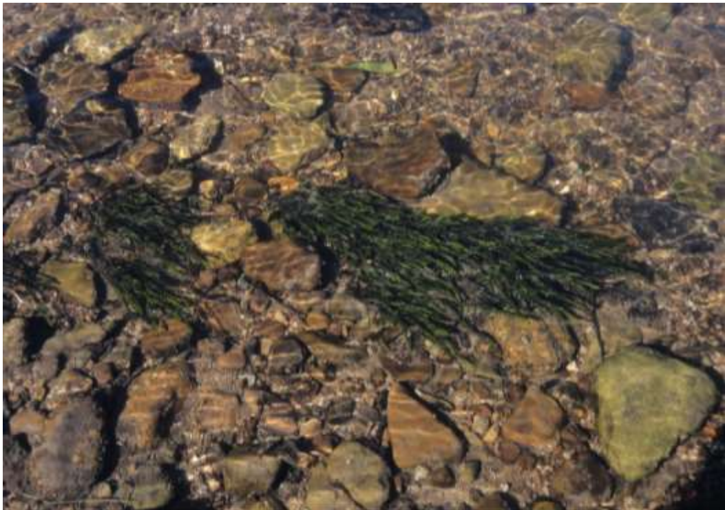
Bild 8: Naturnaher Abschnitt des Eiterbachs [3260] mit Fontinalis antipyretica, 17.08.2011