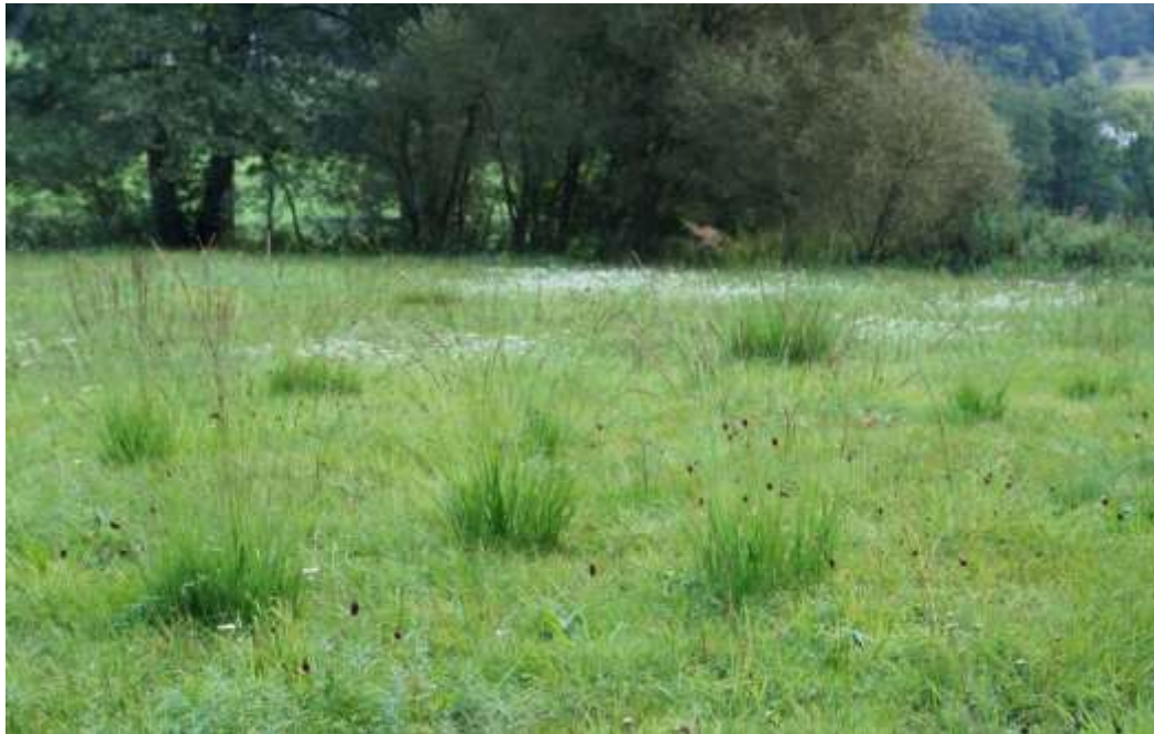
Bild 1: Pfeifengraswiese [6410], Sommeraspekt mit blühendem Großen Wiesenknopf, Steinachtal nördlich Altneudorf