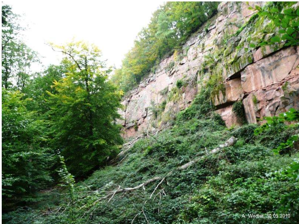
Bild 22: Lebensraumtyp Silikatfelsen mit Felsspaltvegetation [8220], Ziegelhausen, 30.09.2010