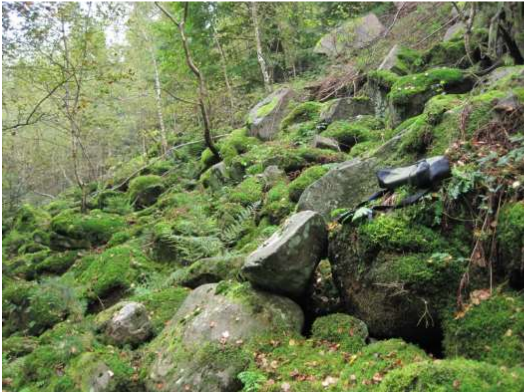
Bild 15: Silikatblockhalde [8220] im Stadtwald Heidelberg, 30.09.2010