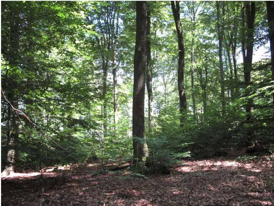
Bild 29: Waldaspekt im Bereich des Fundnachweises. Blick 60° auf Trägerbaum DH01 des Grünen Besenmooses; Linsenteich/Unterer Stadtwald westlich Neckargemünd