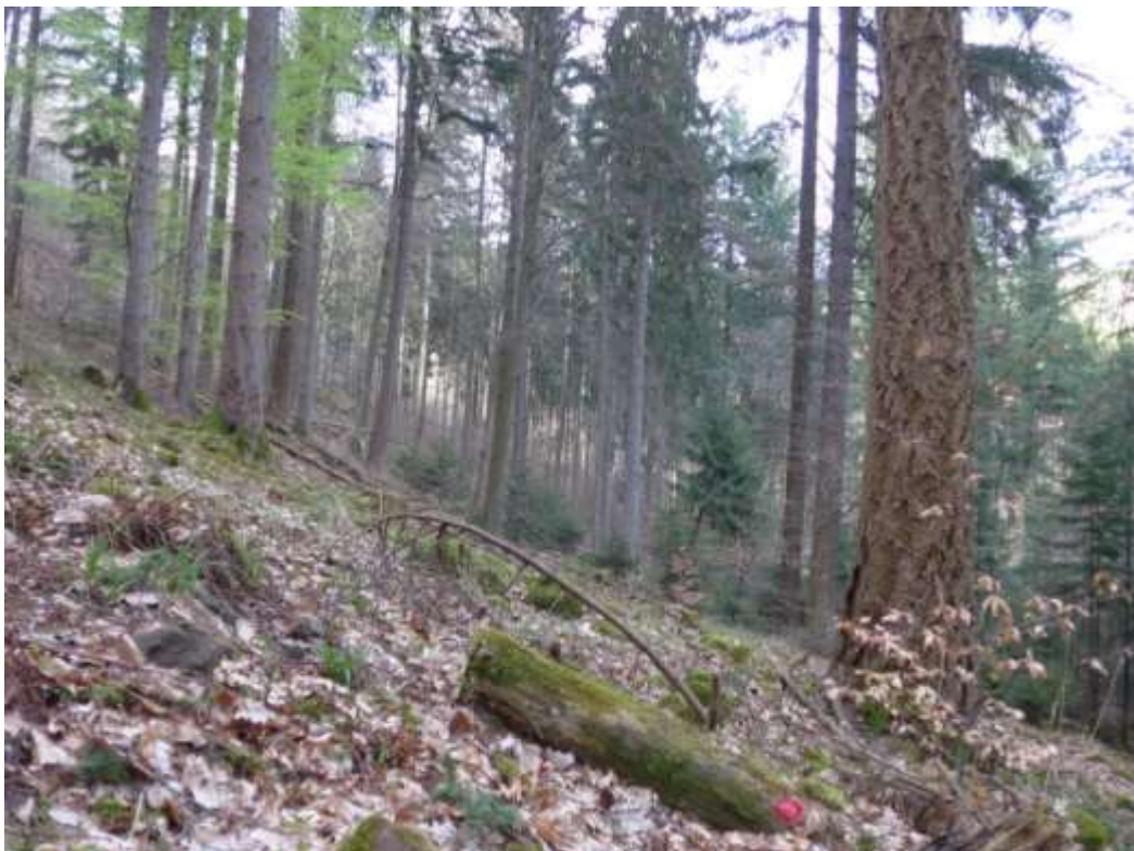
Bild 30: Lebensstätte des Grünen Koboldmooses in mit Nadelmischwald bestockter Klinge, Hellindenschbach, südwestlich Schönau