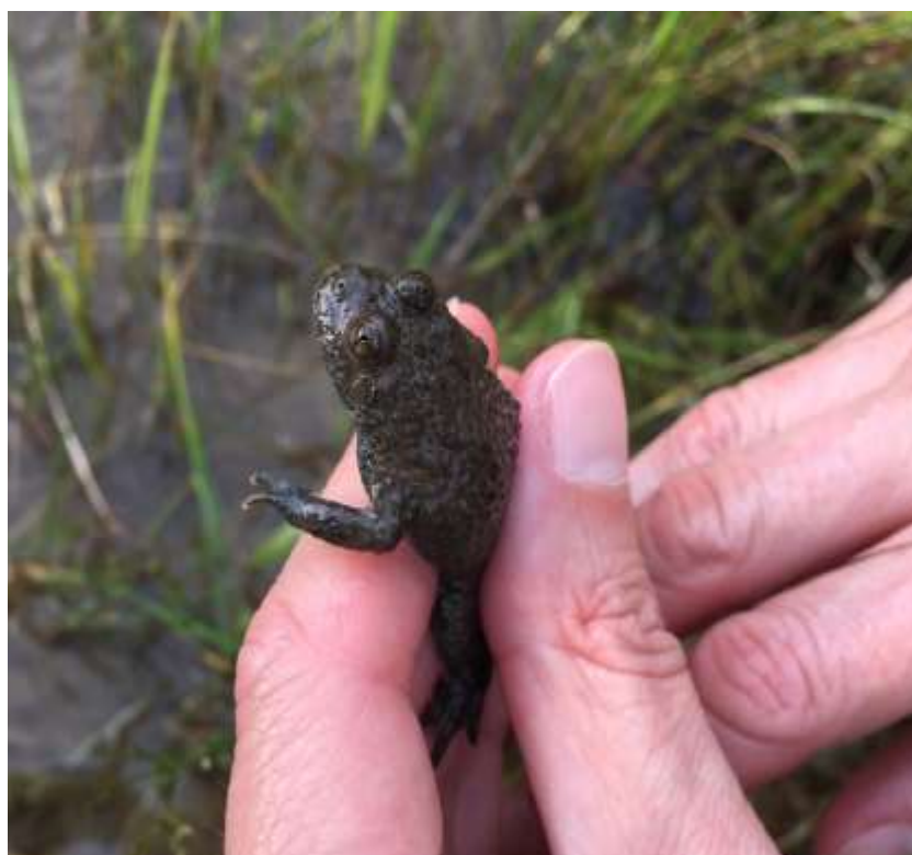
Bild 40: Erwachsene Gelbbauchunke [1193] im Steinbruch Leimen