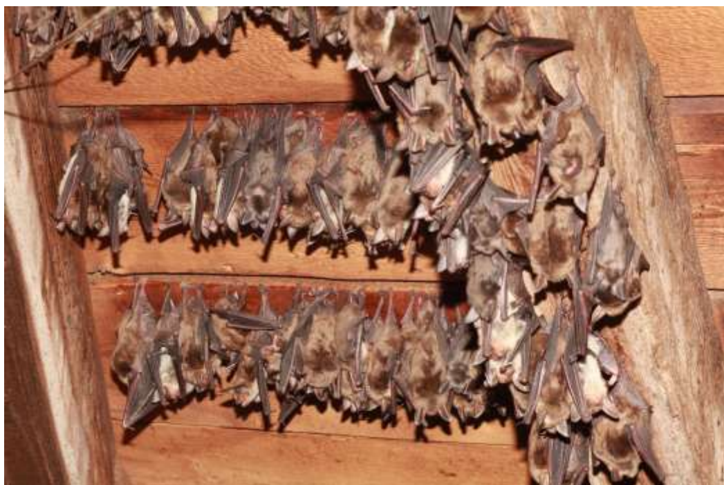
Bild 38: Quartier des Großen Mausohrs in Bammental, 04.07.2019