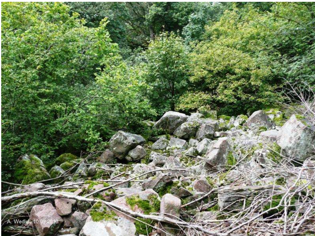
Bild 24: Lebensraumtyp Schlucht- und Hangmischwälder [*9180] und Lebensraumtyp Silikatschutthal- den [8150]