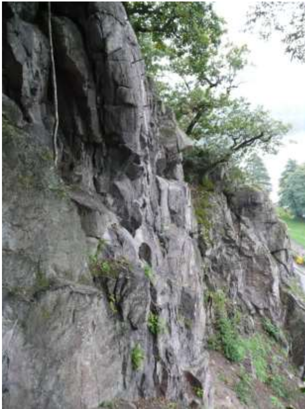
Bild 27: Lebensraumtyp Silikاتفelsen mit Felsspaltvegetation [8220], im Naturschutzgebiet „Russenstein“, mit aufstockendem Hainsimsen-Trauben-Eichenwald, 30.09.2010