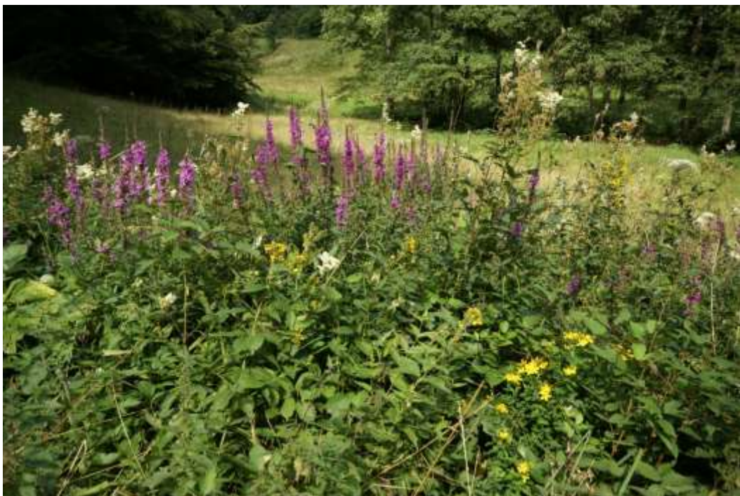
Bild 12: Gewässerbegleitender Hochstaudensaum [6431] im Eiterbachtal, 17.06.2011