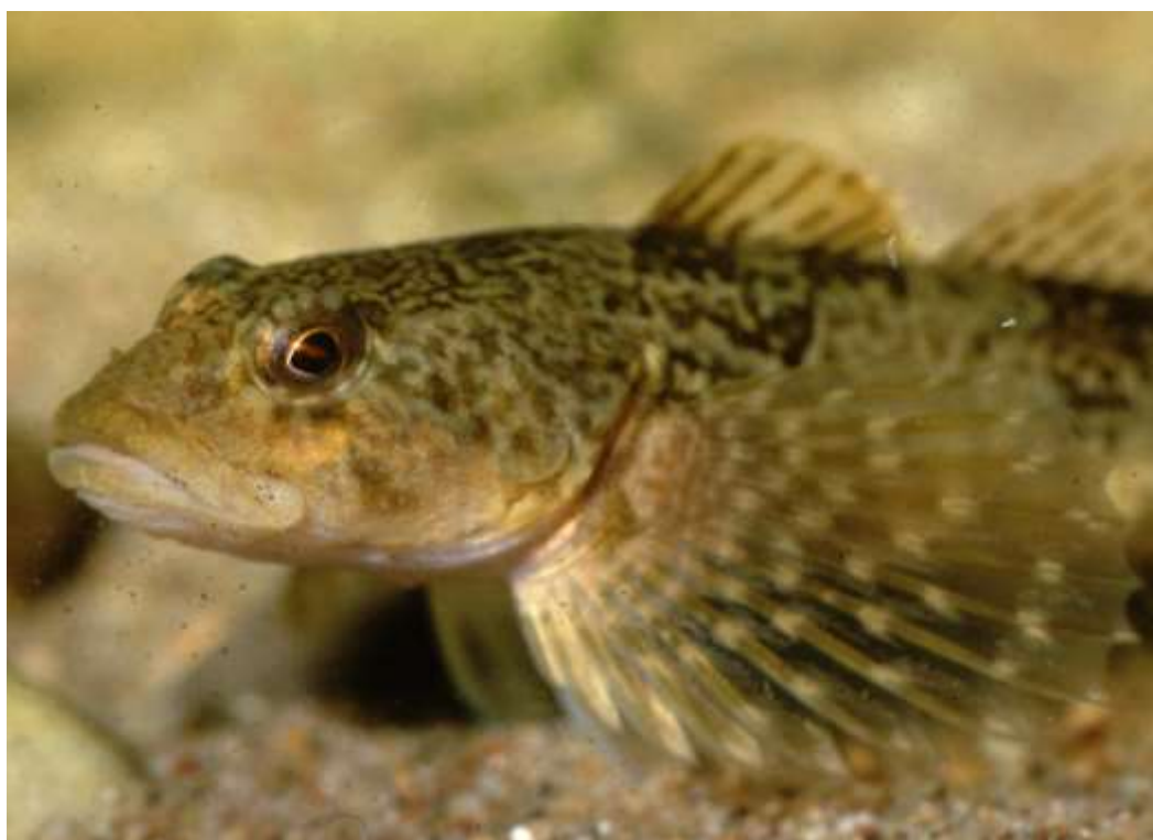
Bild 34: Bei der Befischung der Steinach erfasste Groppe [1163], 20.07.2011