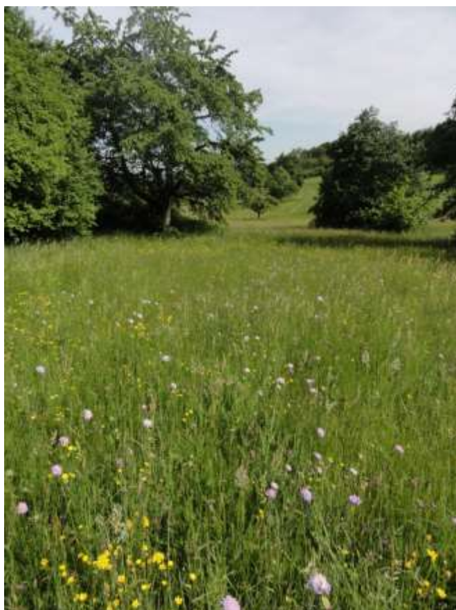
Bild 6: Streuobst mit Mageren Flachland-Mähwiesen bei Waldhilsbach, M. Sonnberger,