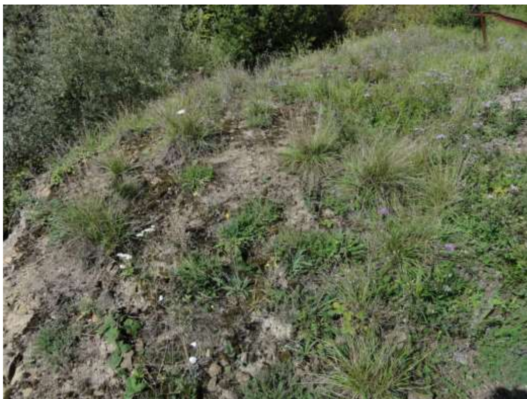
Bild 14: Kalk-Magerrasen [6210] mit Kalk-Aster ( Aster amellus), Steinbruch Leimen, 21.08.2011