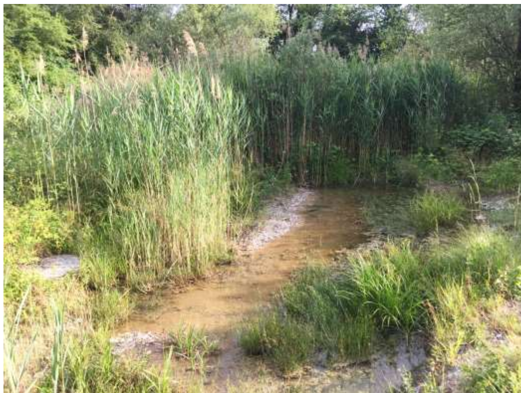
Bild 39: Laichgewässer der Gelbbauchunke [1193] im Steinbruch Leimen