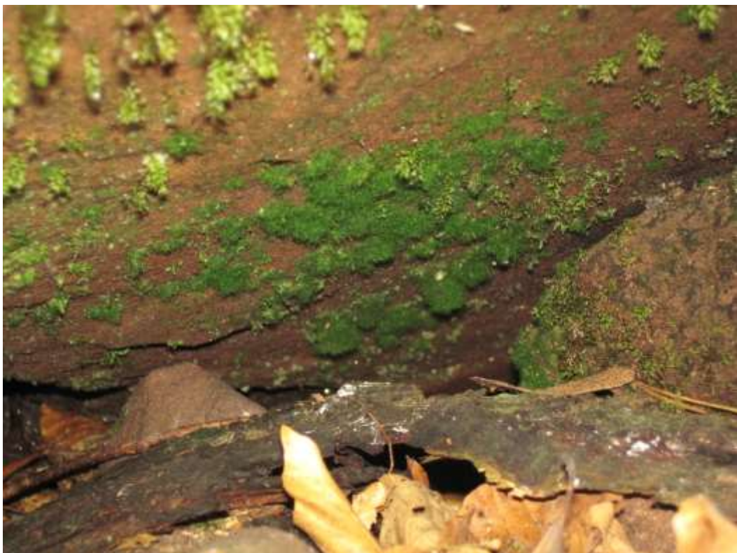
Bild 16: Europäischer Dünnfarn [1421] auf Buntsandsteinfelsen im Kleinen Odenwald, 27.10.2011