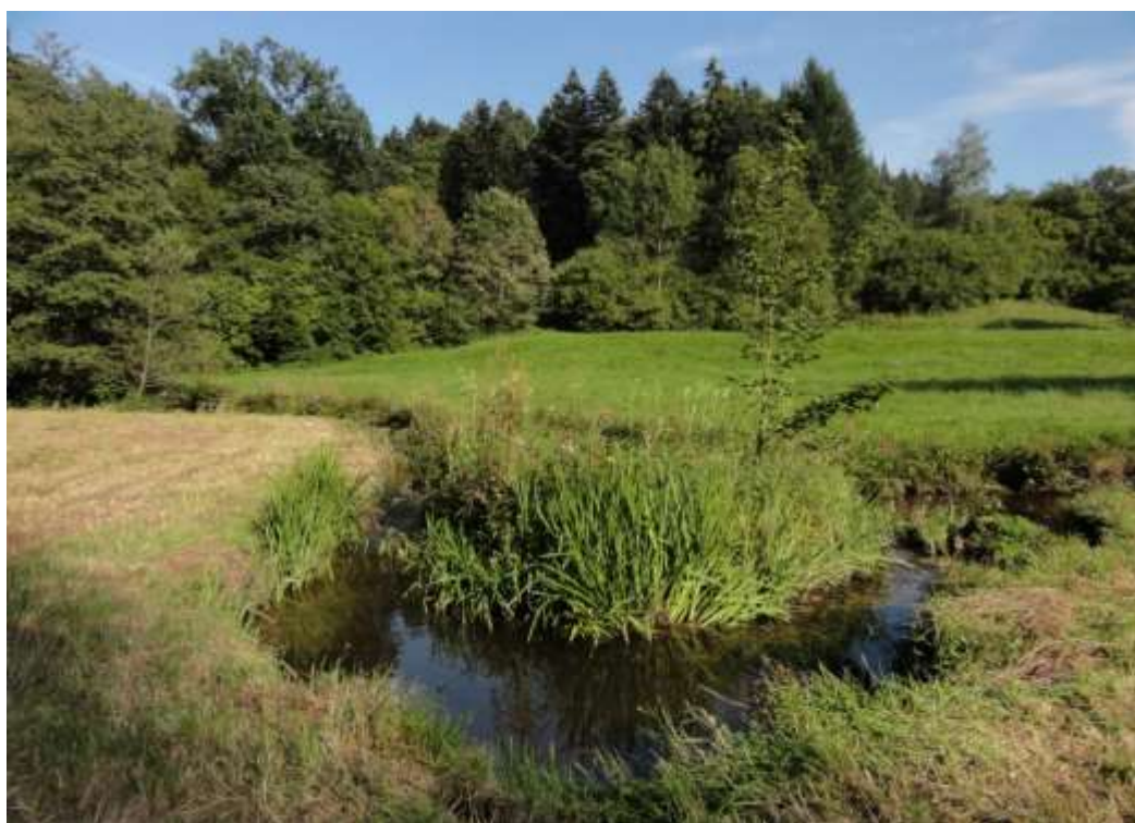
Bild 10: Naturnaher Bachabschnitt [3260] mit begleitenden Feuchtwiesen, Steinachtal bei Altneudorf, 01.09.2011