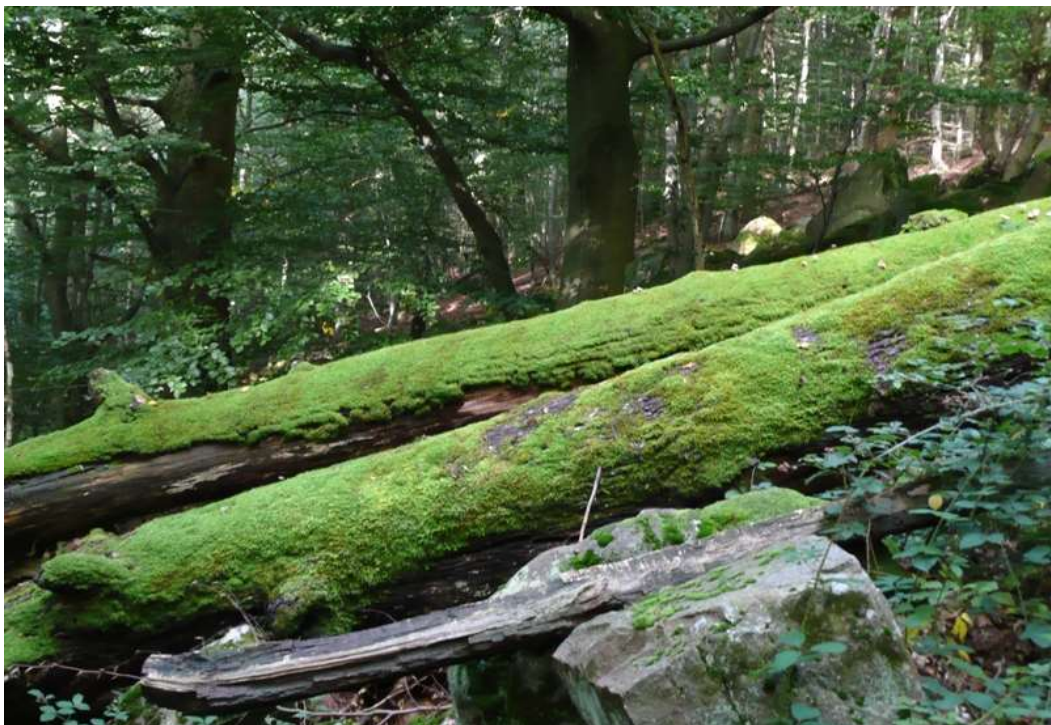
Bild 28: Lebensraumtyp Hainsimsen-Buchenwald [9110], O Schlierbach, 30.09.2010