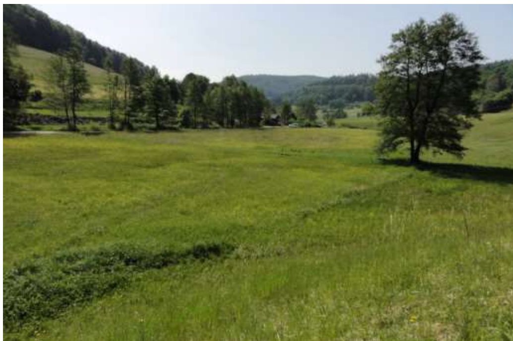
Bild 5: Grünlandkomplex mit Mageren Flachland-Mähwiesen [6510] im Steinachtal nördlich Heiligkreuzsteinach