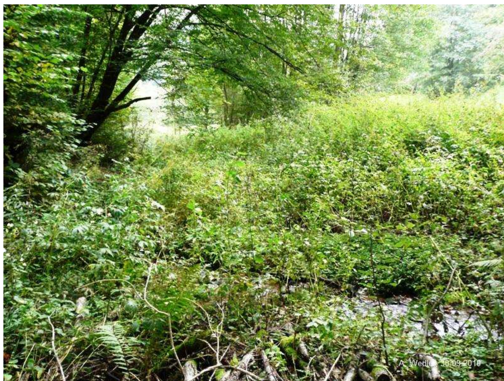
Bild 20: Lebensraumtyp Feuchte Hochstaudenfluren [6431], Eiterbachwiese, 30.09.2010