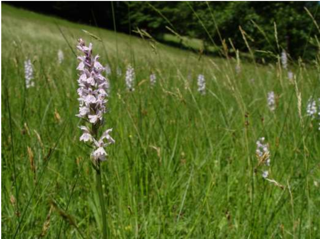
Bild 7: Magere Flachland-Mähwiese [6510] mit Fuchs' Knabenkraut ( Dactylorhiza fuchsii), oberes Steinachtal nahe der Landesgrenze, 12.06.2011