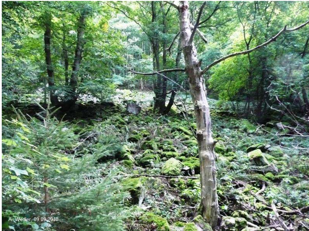
Bild 21: Lebensraumtyp Silikatschutthalden [8150] in Lebensraumtyp Schlucht- und Hangmischwälder [*9180], Schlierbach- Breitried, 09.09.2010