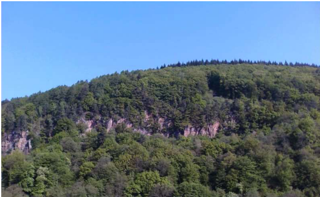
Bild 44: NSG Felsenberg mit Steilwänden, Lebensstätte des Wanderfalken