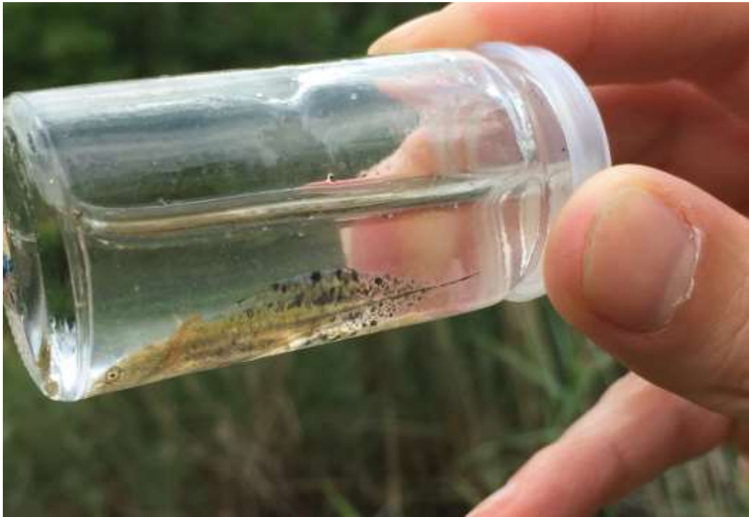
Bild 41: Larve des Kammolchs [1166] aus dem Steinbruch Leimen, 18.06.2019