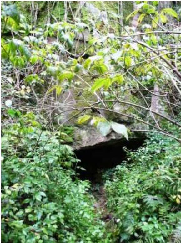
Bild 23: Lebensraumtyp Höhlen und Balmen [8310], Ziegelhausen, 30.09.2010