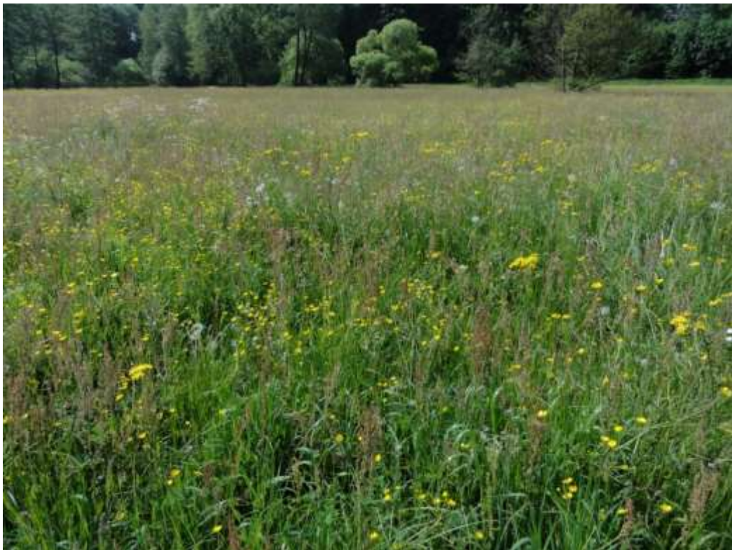
Bild 4: Magere Flachland-Mähwiese [6510], Steinachtal bei Heiligkreuzsteinach, 14.05.2011