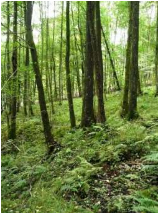
Bild 25: Lebensraumtyp Auenwälder mit Erle, Esche, Weide [*91E0], Eiterbachtal, 30.09.2010