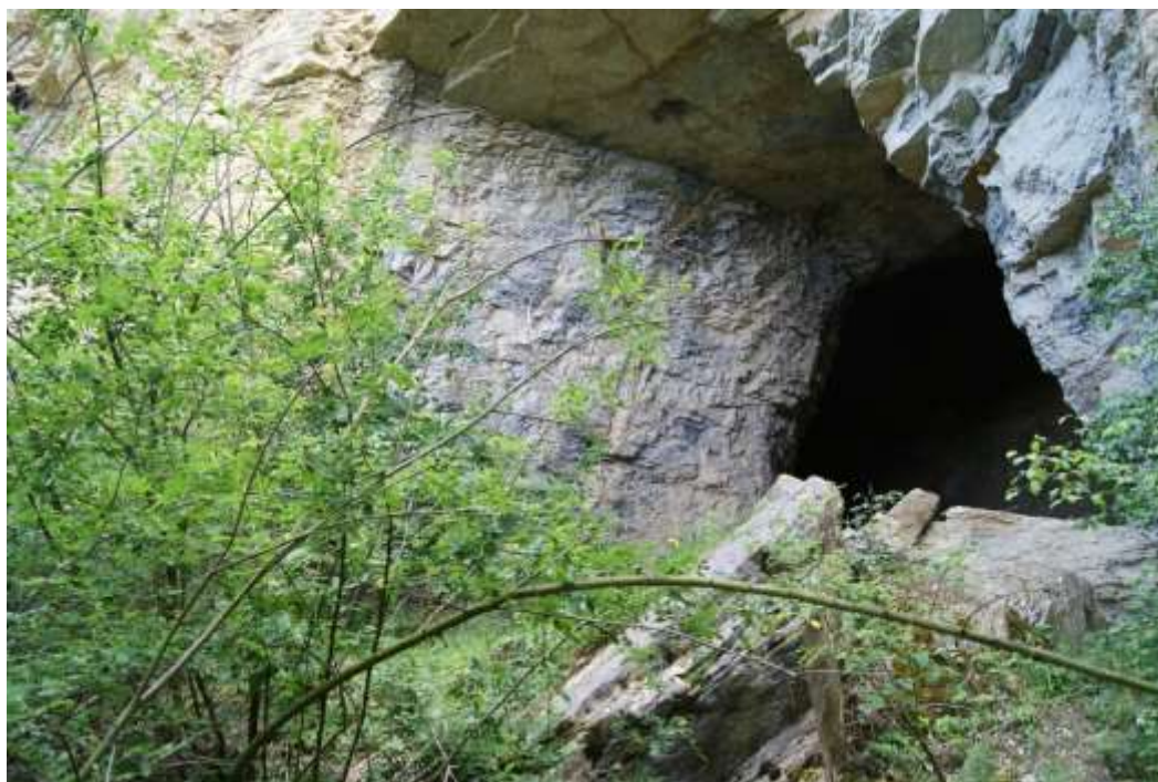
Bild 37: Steinbruch Leimen, Stolleneingang, 24.06.2011