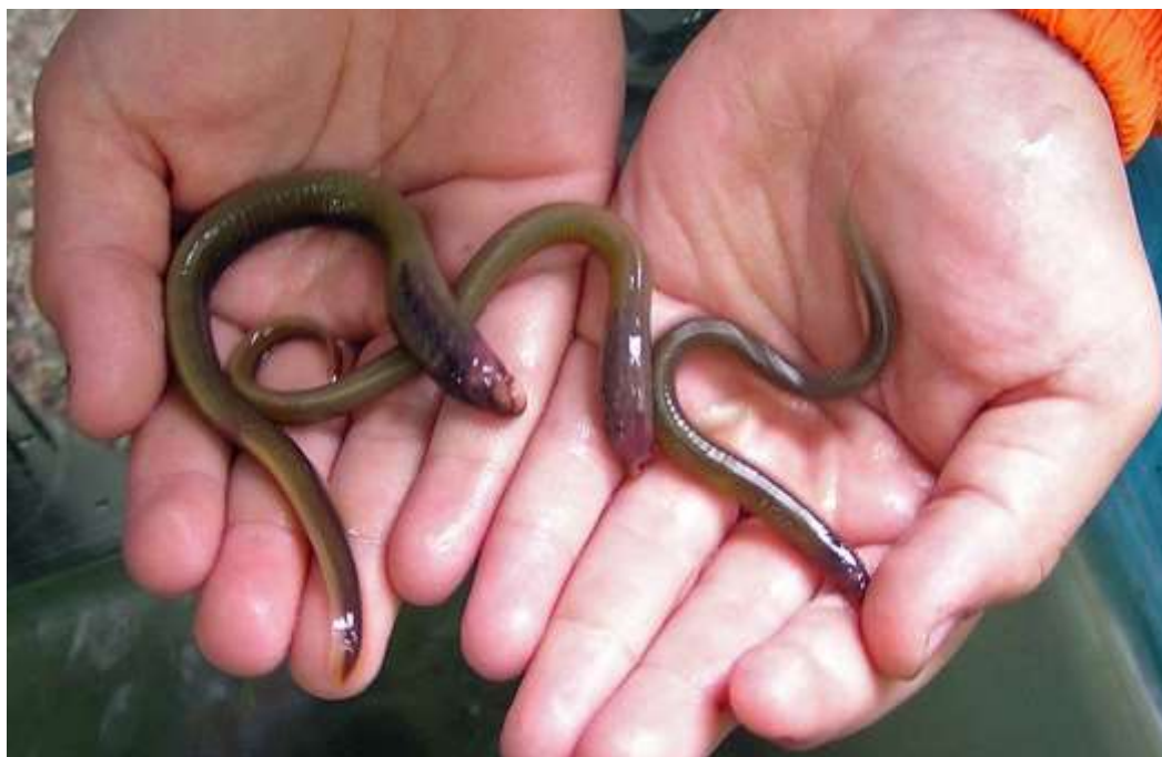
Bild 33: Bachneunaugen [1096] aus der Steinach, 20.07.2011