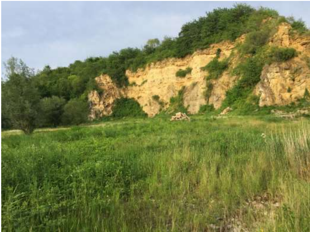
Bild 43: Steilwand im Steinbruch Leimen mit Nistmöglichkeiten für den Uhu, 18.06.2019