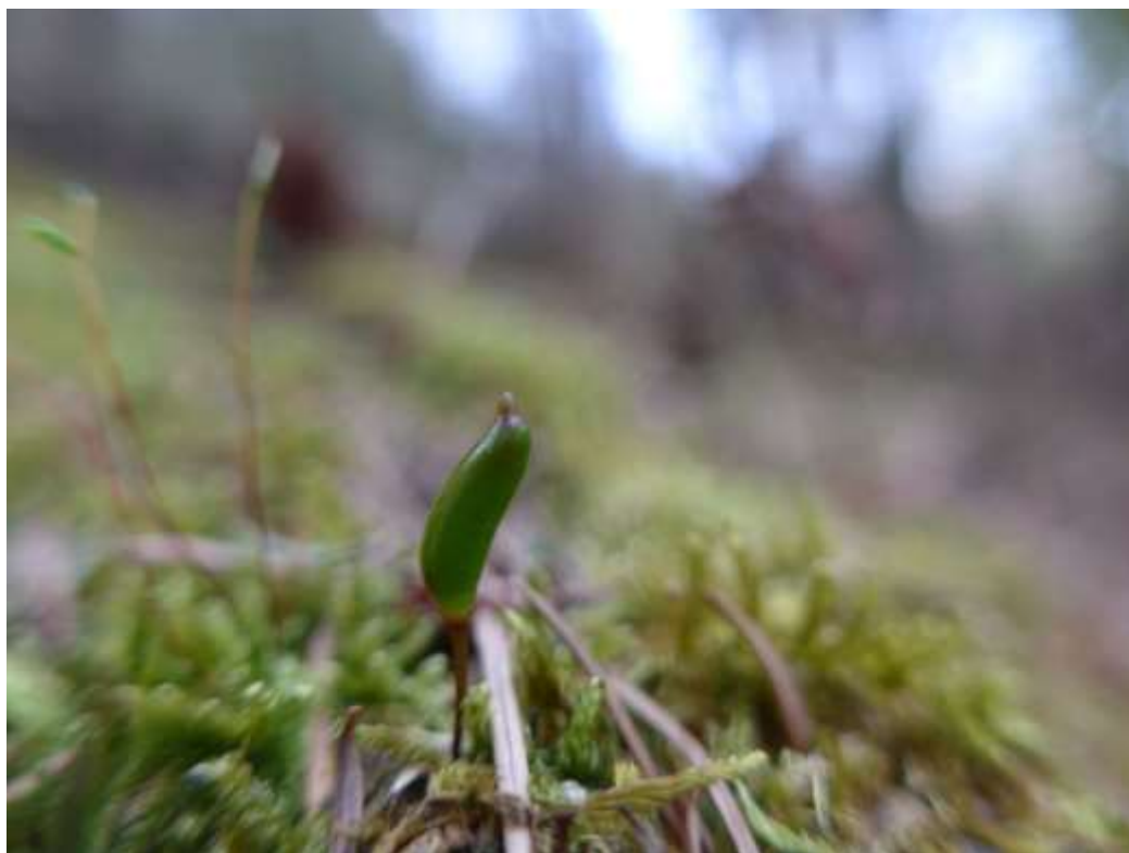
Bild 31: Grünes Koboldmoos auf Kilbenstück in jungem Fichtenforst, Hellindenbach, südwestlich Schönau, 12.04.2018