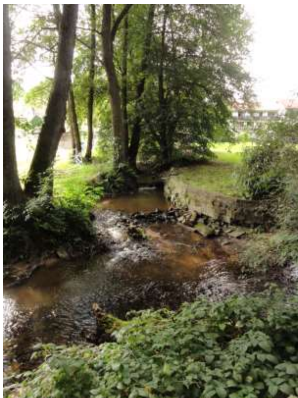
Bild 9: Naturnaher Bachabschnitt [3260] mit uferbegleitendem Auwaldstreifen [LRT *91E0], oberes Steinachtal, 30.08.2011