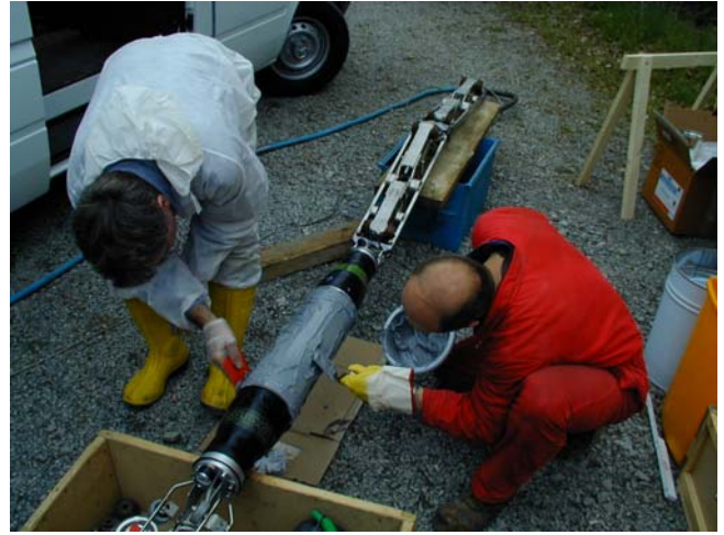
Bild 2 und 3: Robotersystem Oskar und Aufbringen von Epoxidharz auf eine Edelstahlschale