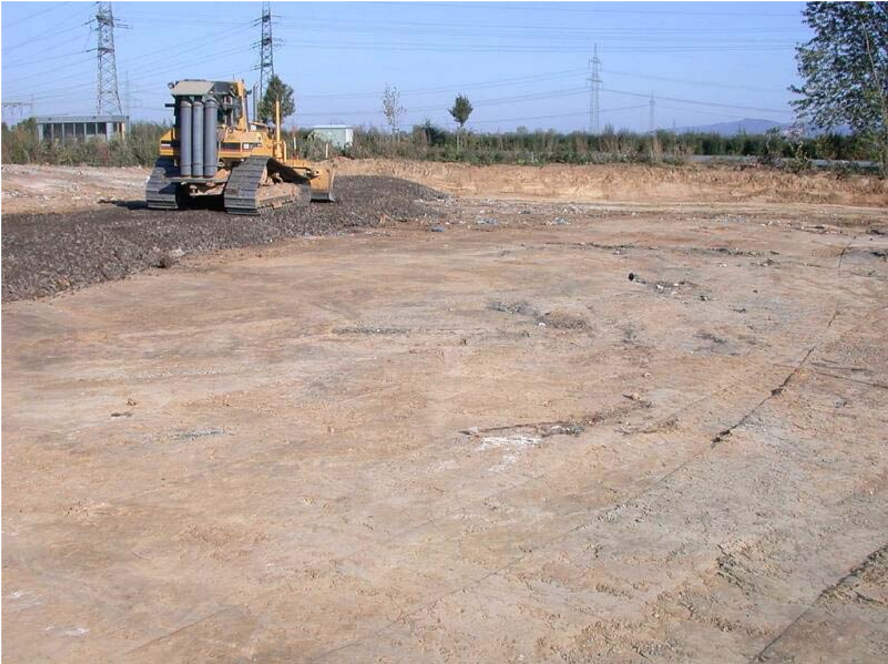
Bild 19: Herstellen neues Abfallzwischenlager am Nordrand der Deponie

Am Nordrand der Deponie wird innerhalb der Auffüllung ein neues Abfallzwischenlager eingerichtet. Zur Herstellung eines tragfähigen Unterbaues wurde zunächst ein Bodenaustausch vorgenommen. In einer Mächtigkeit von bis zu 80 cm wurde zur Stabilisierung Gleisschotter eingebaut