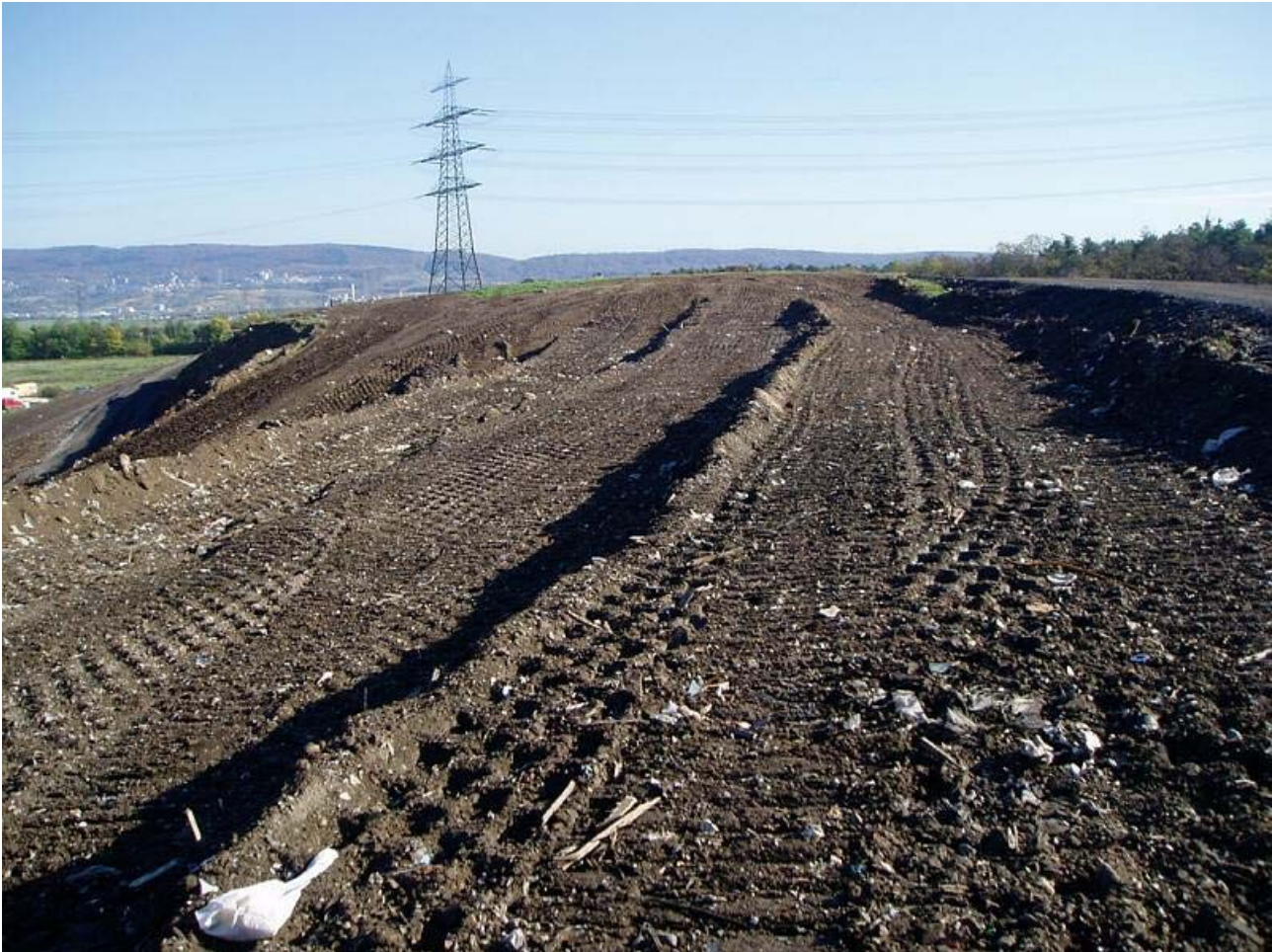
Bild 17: Lagenweises Verfüllen des ehemaligen Abfallzwischenlagers im Ostteil der Deponie

Die umzulagernden Abfälle werden im Bereich des ehemaligen Abfallzwischenlagers lagenweise eingebaut und verdichtet. Alle 4.000 m 2 eingebauter Fläche wird eine Verdichtungskontrolle durchgeführt