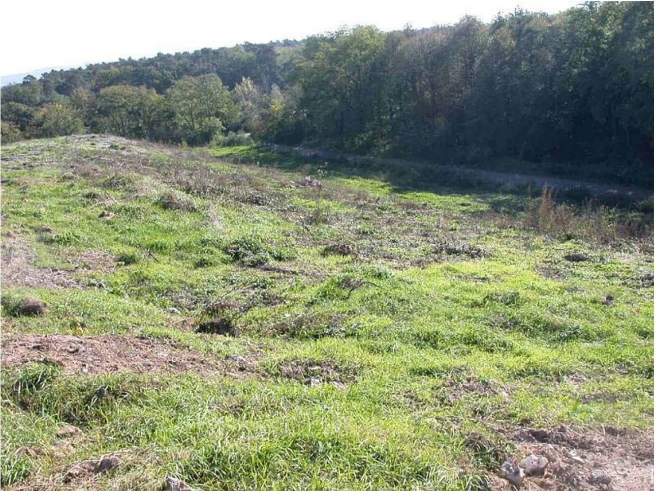
Bild 3: Darstellung der Südböschung der Deponie nach der durchgeführten Rodung