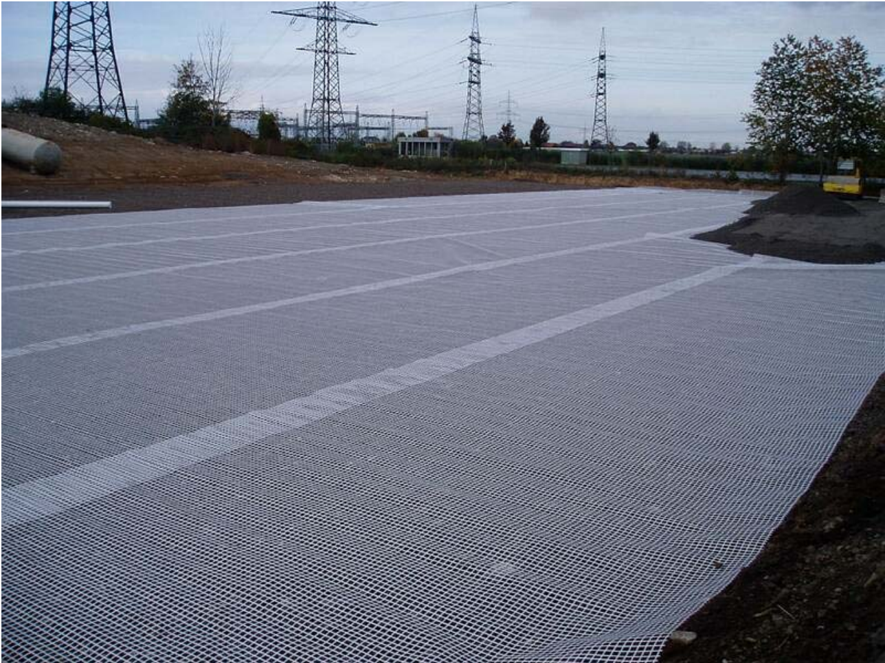
Bild 20: Herstellung der neuen Abfallzwischenlagerfläche am Nordrand der Deponie

Am Nordrand der Deponie wird ein neues Abfallzwischenlager bestehend aus einer Tragschicht, und bituminösen Tragdeckschicht und Deckschicht eingerichtet. Da sich die Fläche im aufgefüllten Bereich befindet wurde unter die KFT- Schicht ein Geogitter verlegt