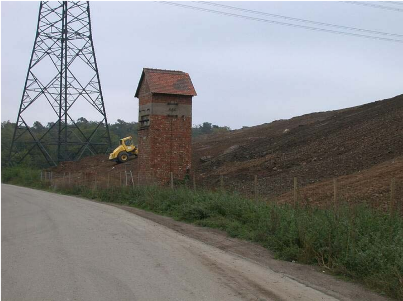
Bild 9: ehemalige Stromverteilerstation am Deponiefuß am Nordrand

Die ehemalige Stromverteilerstation am Nordrand der Deponie wurde rückgebaut, die Materialien wurden als Profilierungsmaterial eingebaut