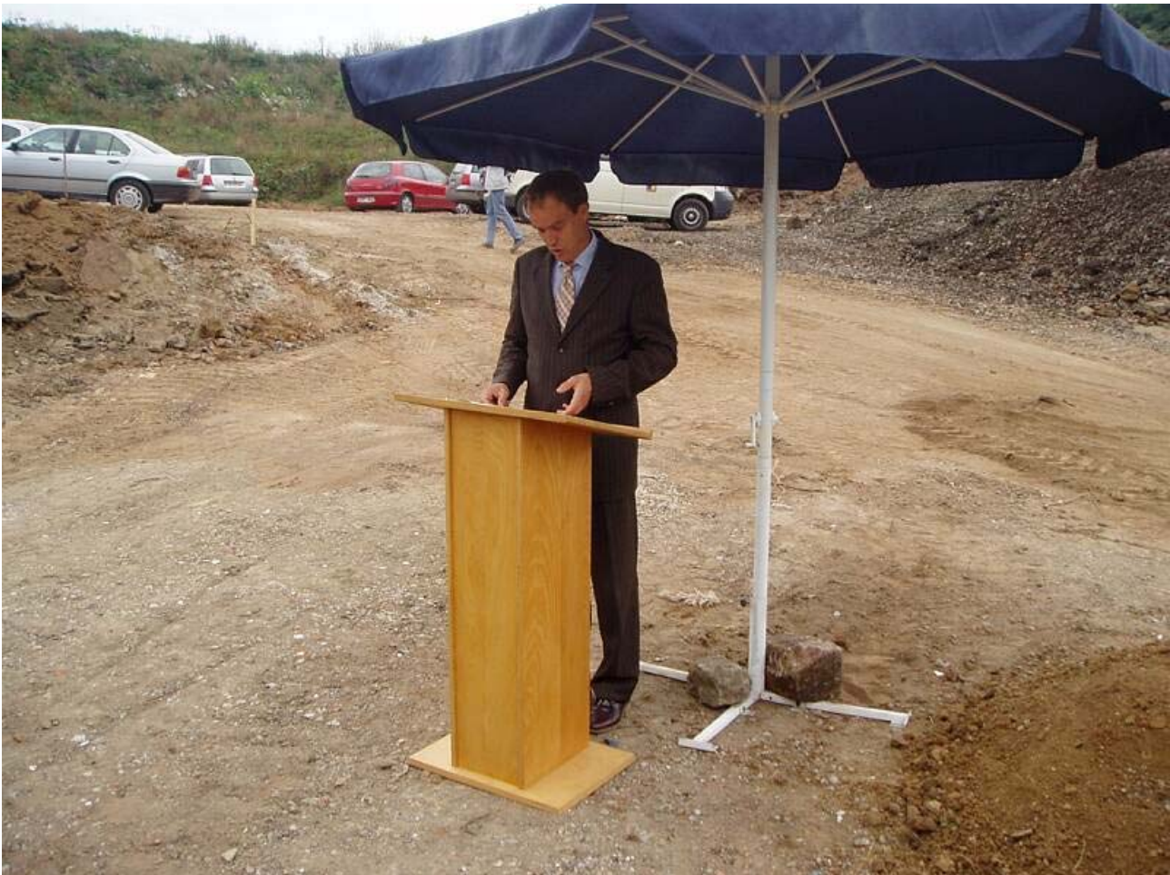
Bild 1: Im September 2005 fand der erste Spatenstich auf der Deponie Feilheck statt

Bürgermeister Dr. Würzner begrüßte eine Vielzahl an geladenen Gästen