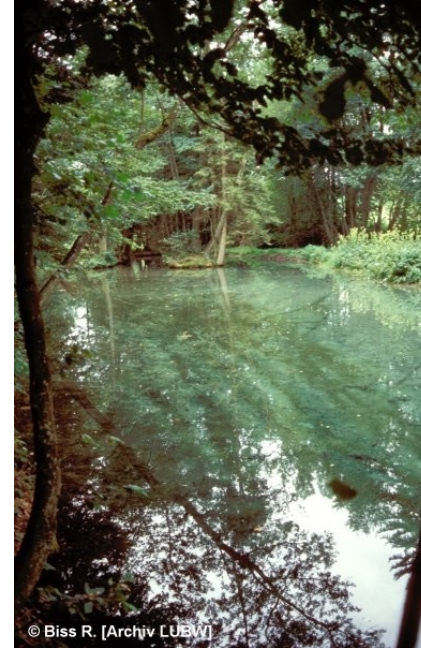
Grundwasseraustritt in einem Quell- tümpel

geschützt nach § 32 NatSchG 1.9 Quellbereiche FFH 3140 Kalkreiche, nährstoffarme Stillgewässer mit Armeleuchteralgen FFH *7220 Kalktuffquellen* * Prioritärer Lebensraum