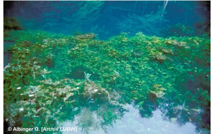
Starker Grundwasseraustritt in einem Quelltopf mit großem Einzugsbereich in einem Karstgebiet.

geschützt nach § 32 NatSchG 1.9 Quellbereiche FFH 3140 Kalkreiche, nährstoffarme Stillgewässer mit Armeleuchteralgen FFH *7220 Kalktuffquellen* * Prioritärer Lebensraum