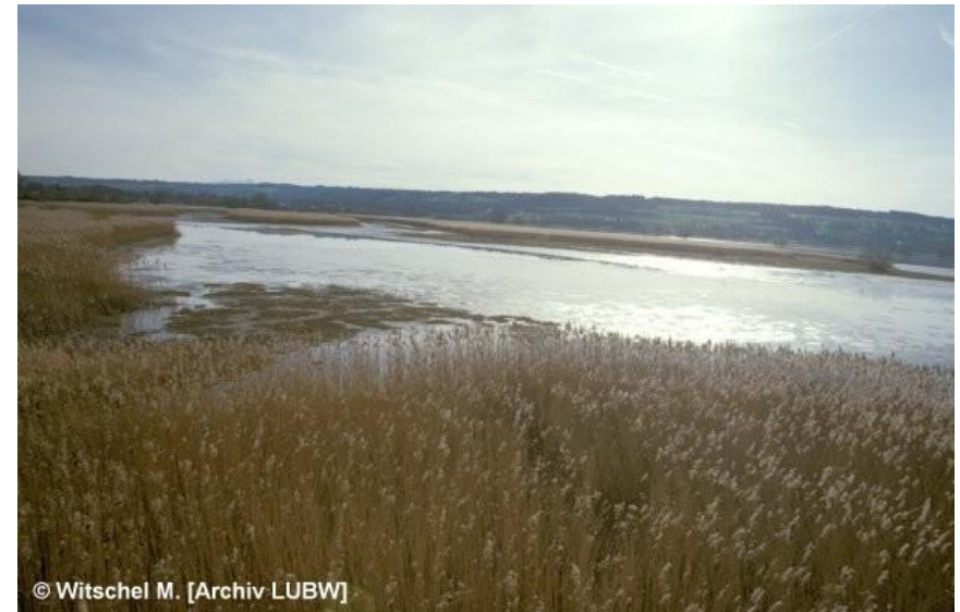
Baden-württembergischer Anteil des Bodensees mit naturnahem Uferbereich, naturnaher Flachwasserzone und Tiefwasserzone.